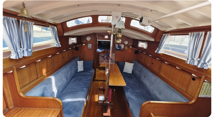
6 KR A&R Kielschwertyacht 1