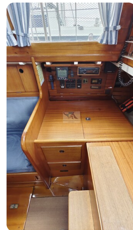
6 KR A&R Kielschwertyacht 17