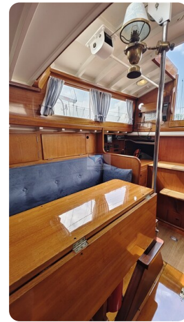
6 KR A&R Kielschwertyacht 10