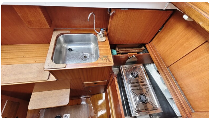
6 KR A&R Kielschwertyacht 16