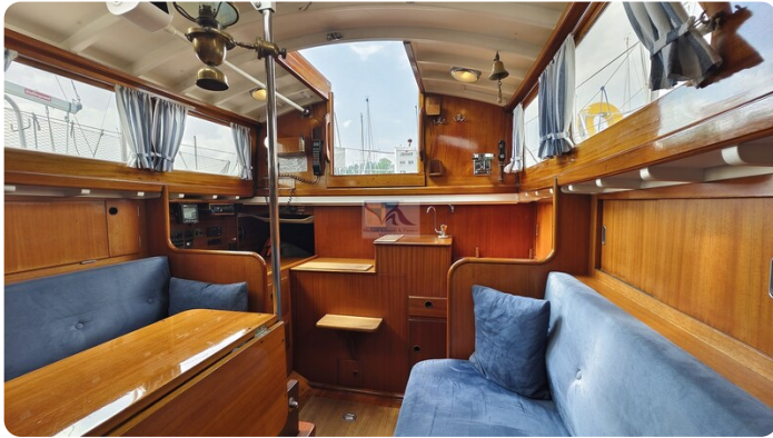
6 KR A&R Kielschwertyacht 6