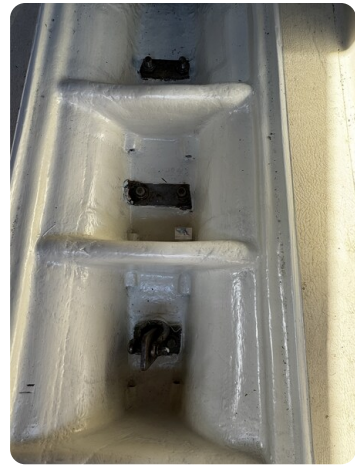
Albin Express 15