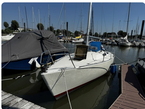
Albin Express 1