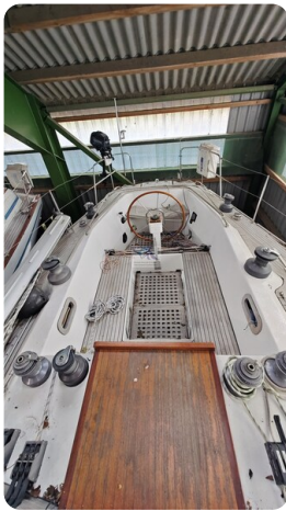
Feltz Alu One Off_27