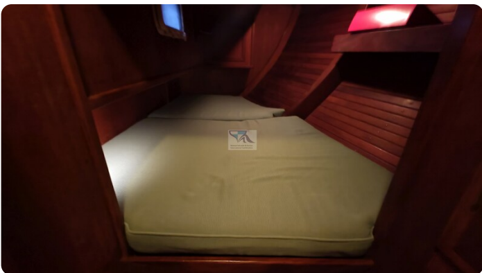
Feltz Alu One Off_75