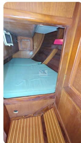
Feltz Alu One Off_77