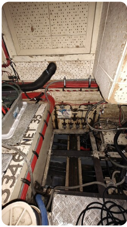
Grand Banks 48_msp789980 10