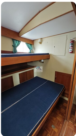
Grand Banks 48_msp789980 17