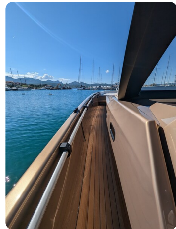
Apex 60 sideways