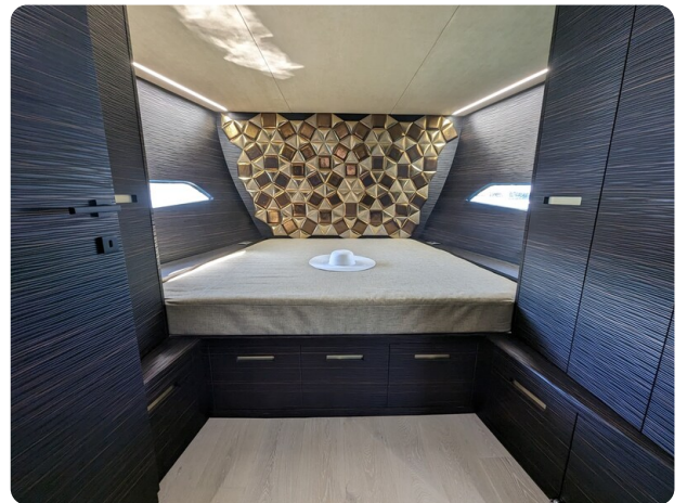
Apex 60 cabin