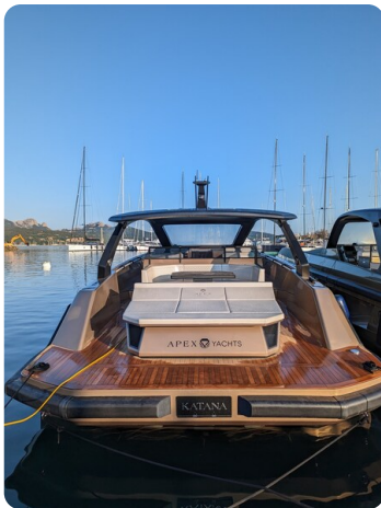
Apex 60 stern view