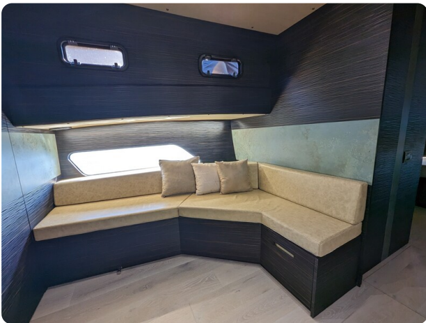
Apex 60 port dinette