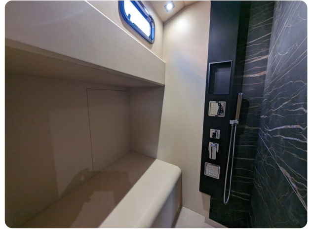
Apex 60 shower