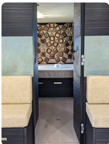
Apex 60 interiors