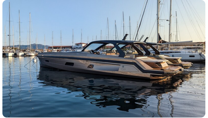
Apex 60 aft profile closed