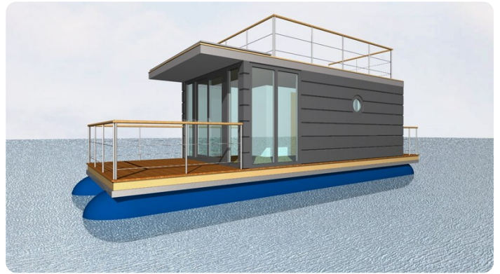
2021.05.17 - kerrafront VOX trend antracyt - widok 1(2)