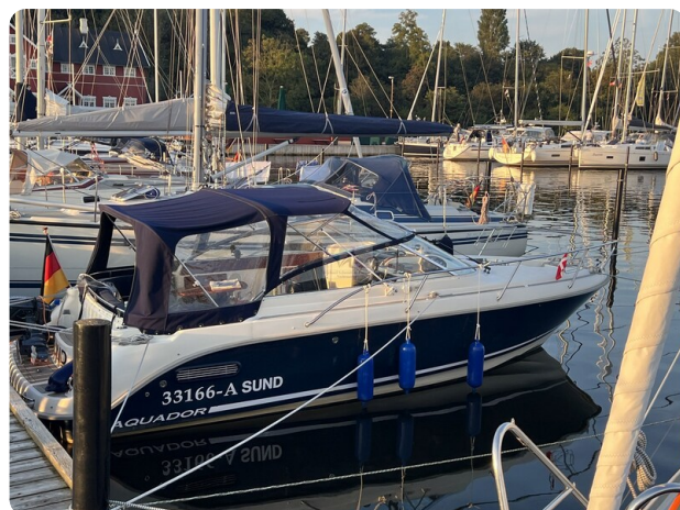
Aquador 23 7