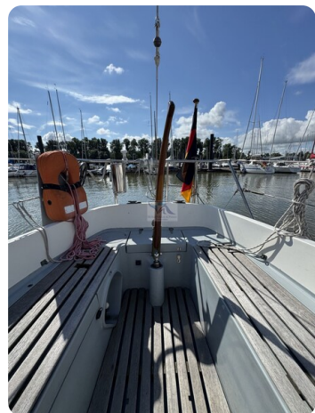
S & S 30 IVALU 12