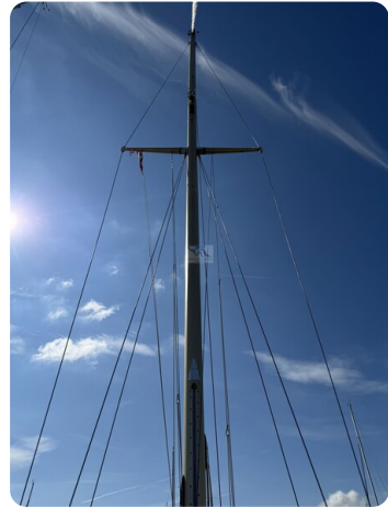
S & S 30 IVALU 35