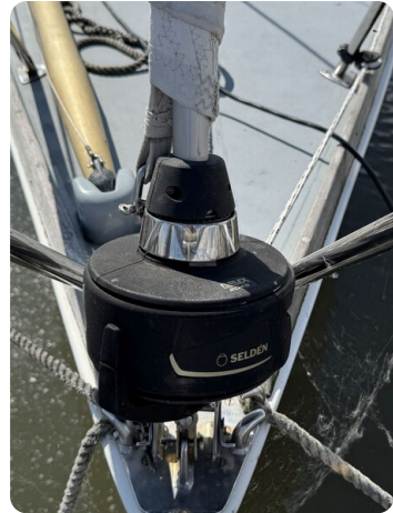
S & S 30 IVALU 2