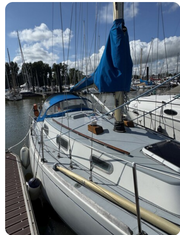
S & S 30 IVALU 3