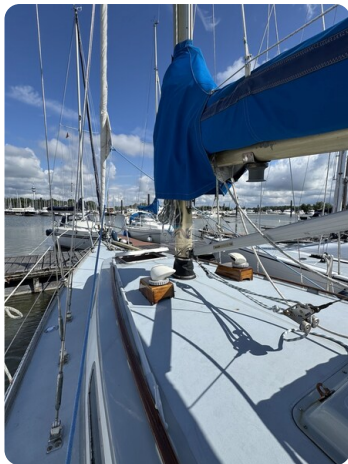
S & S 30 IVALU 34