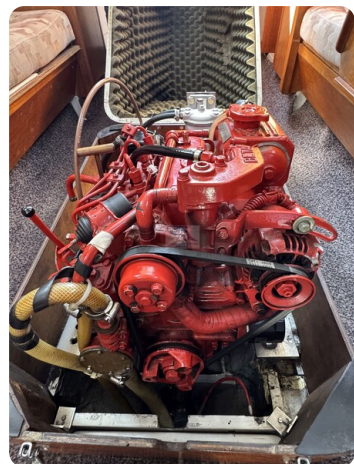
S & S 30 IVALU 27