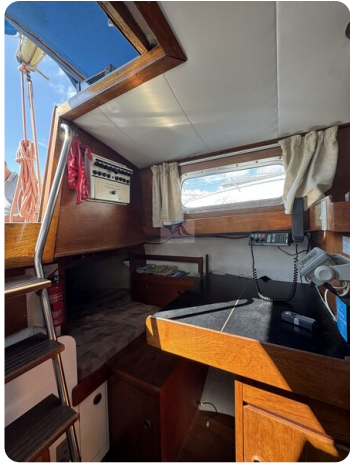
S & S 30 IVALU 51