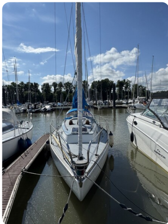
S & S 30 IVALU 4