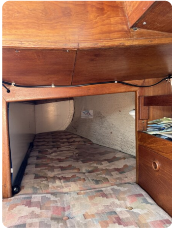
S & S 30 IVALU 1