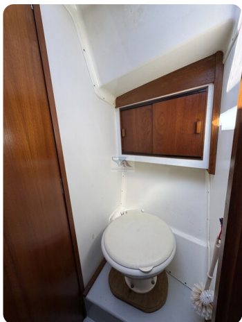
S & S 30 IVALU 55