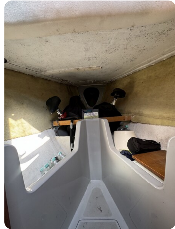
S & S 30 IVALU 57