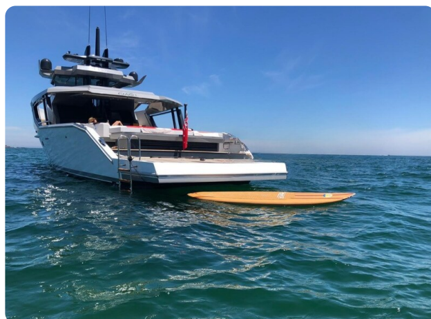
CIAO! profile bwd