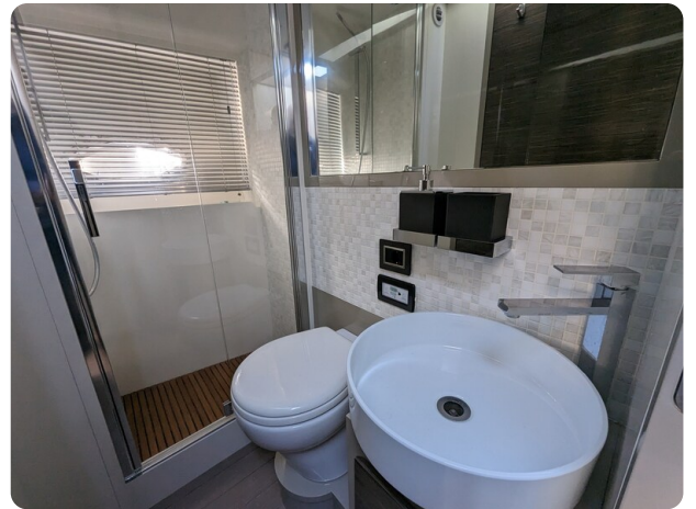
AP 44 Sedan guest bathroom