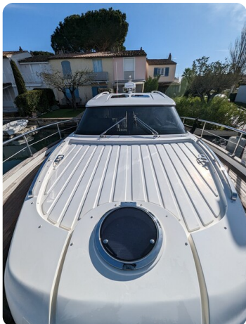
AP 44 Sedan fwd deck