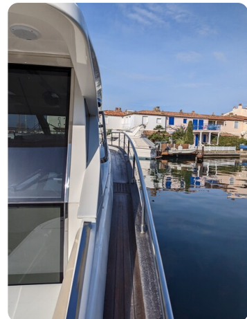
AP 44 Sedan sideways