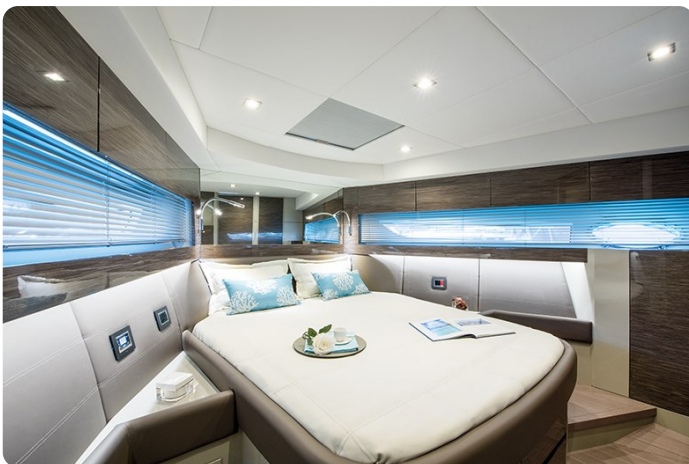
AP 44 Sedan owner's cabin