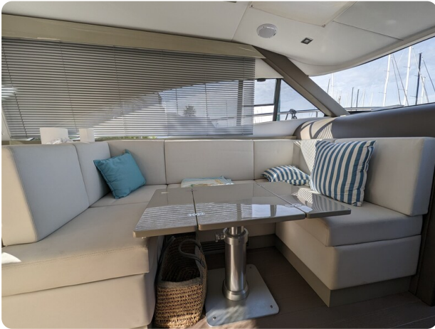
AP 44 Sedan dinette