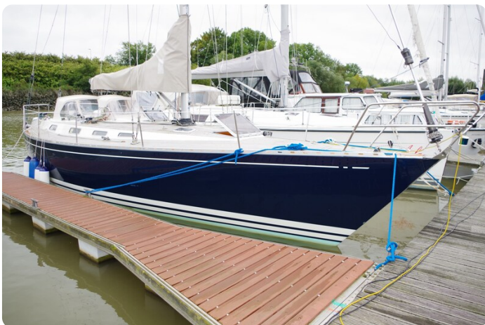
Avance 40 msp636285 2