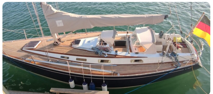
Avance 40 msp636285 1