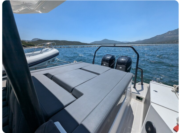
Axopar 37 Sun Top Brabus, aft sunpad