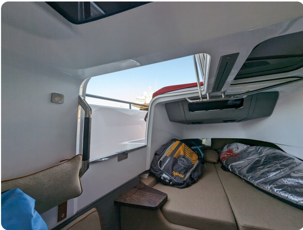
Axopar 37 XC cabin side door