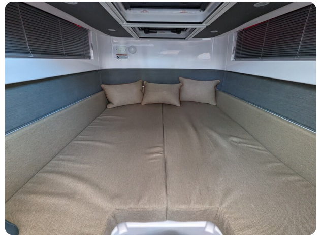
Axopar 37 XC aft cabin