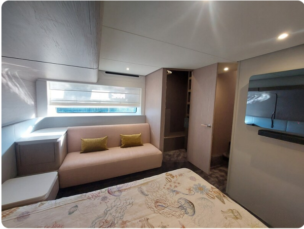
Azimut 53 Fly owner's cabin