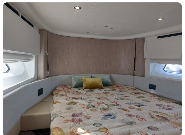
Azimut 53 Fly vip cabin