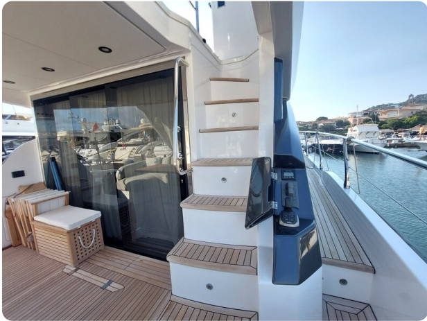
Azimut 53 Fly cockpit detail