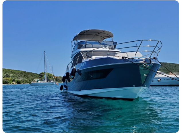
Azimut 53 Fly