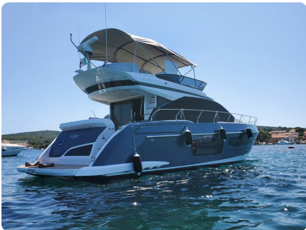
Azimut 53 Fly