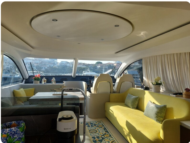
Azimut 53 Fly El Bibes-16