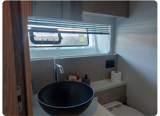
Azimut 53 Fly bathroom