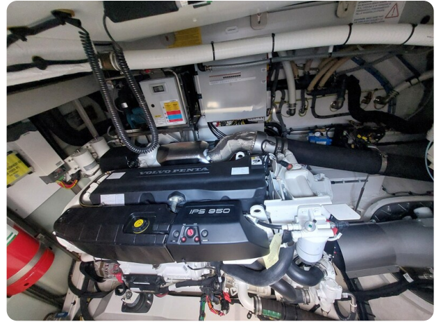
Azimut 53 Fly engine detail