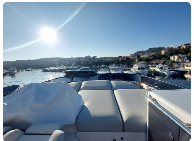
Azimut 53 Fly El Bibes-8