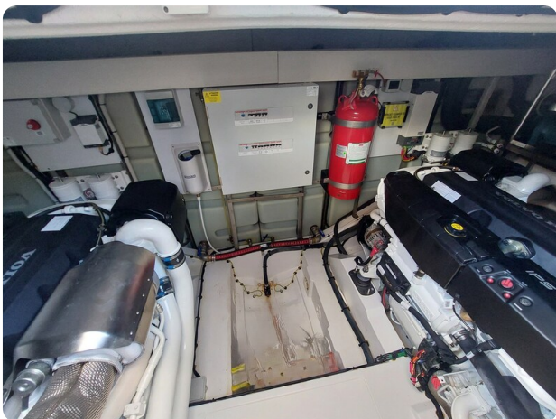
{1} Engine room