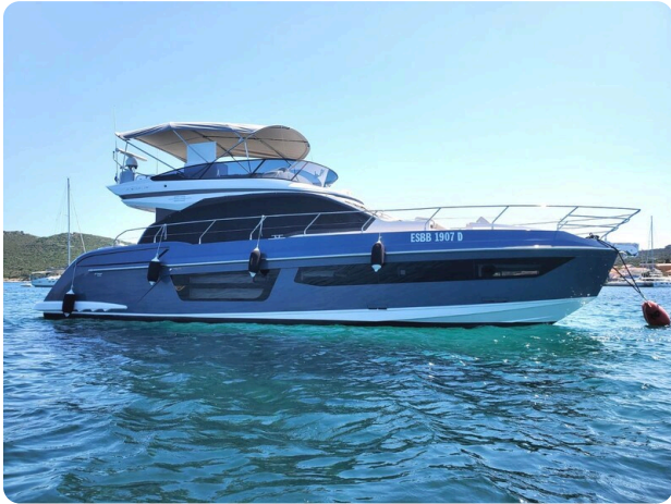
Azimut 53 Fly