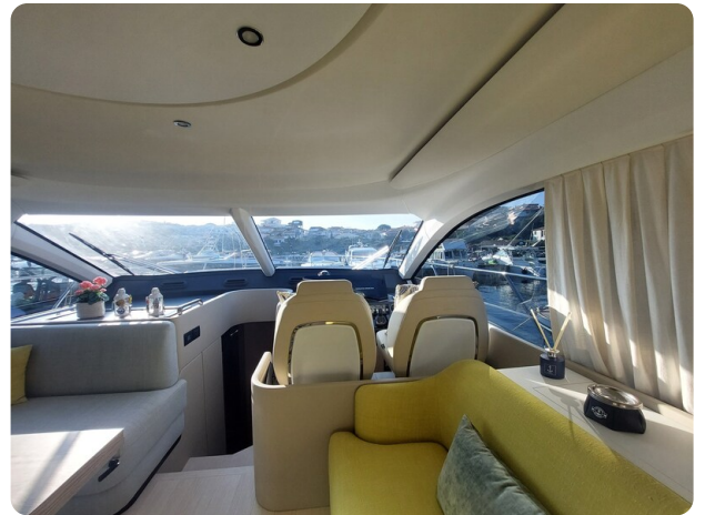
Azimut 53 Fly El Bibes-33