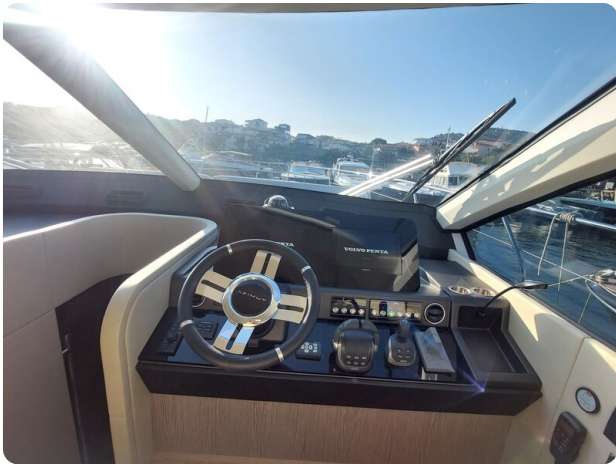
Azimut 53 Fly El Bibes-31