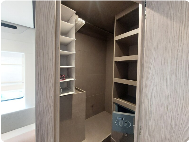
Azimut 53 Fly wardrobe