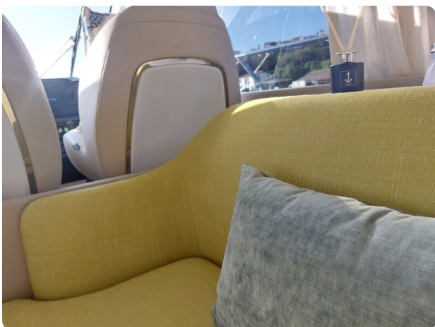
Azimut 53 Fly El Bibes-13