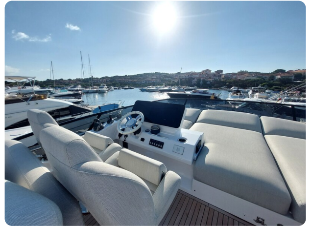
Azimut 53 Fly helm station