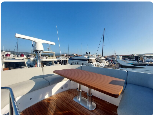
Azimut 53 Fly El Bibes-9