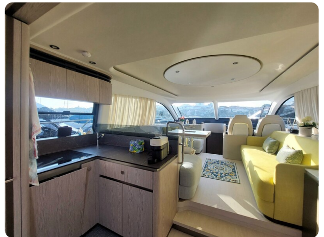
Azimut 53 Fly El Bibes-36