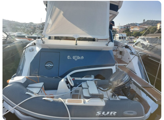
Azimut 53 Fly El Bibes-38