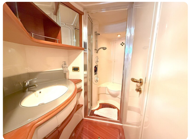
AZIMUT 55 Guest Head detail