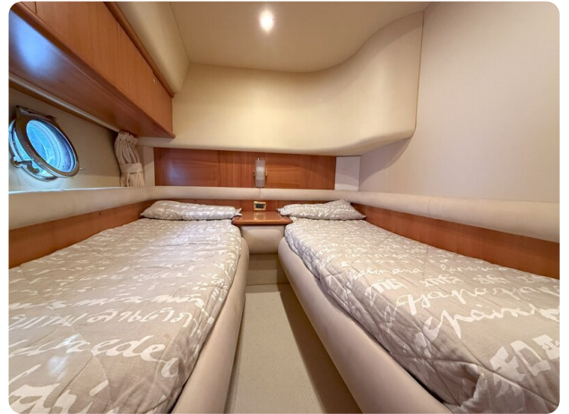
AZIMUT 55 Double cabin