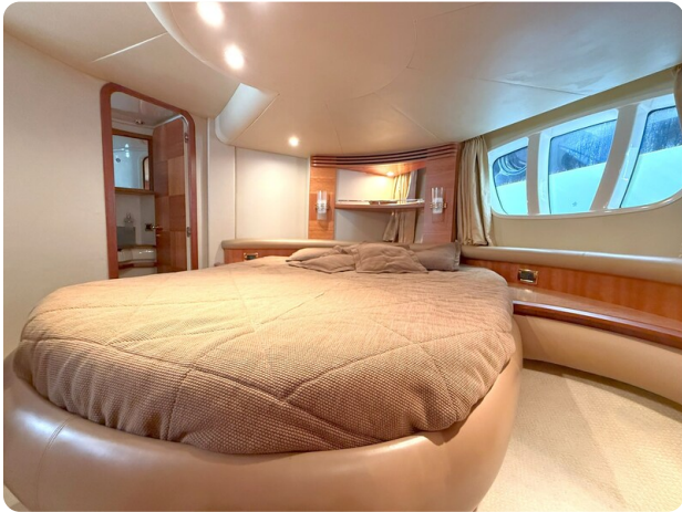
AZIMUT 55 Guest Cabin