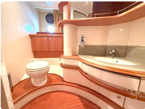
AZIMUT 55 Guest Head