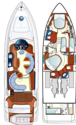
Azimut 55 fly layout