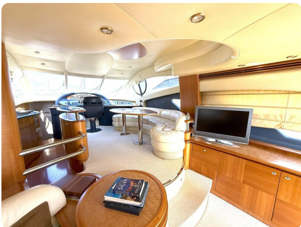
AZIMUT 55 Salon detail