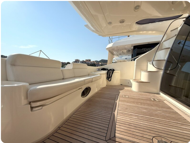
AZIMUT 55 cockpit