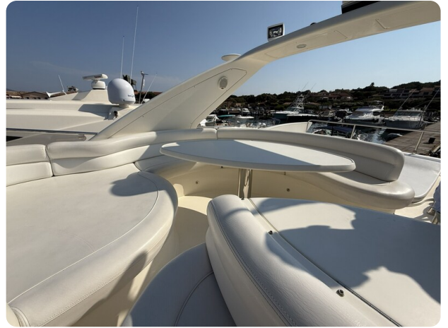
AZIMUT 55 Fly dinette