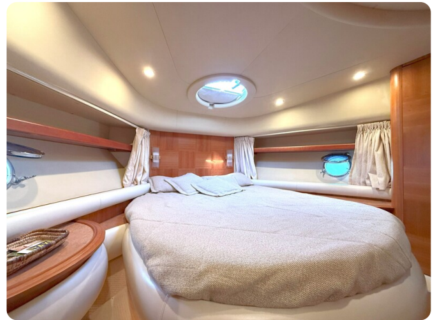
AZIMUT 55 Owner's cabin detail light