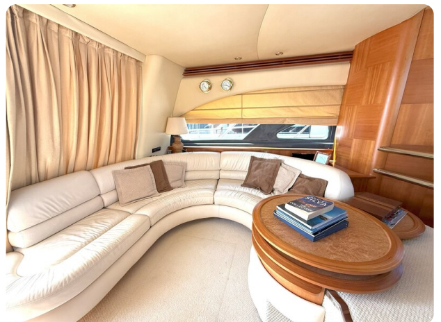
AZIMUT 55 Dinette