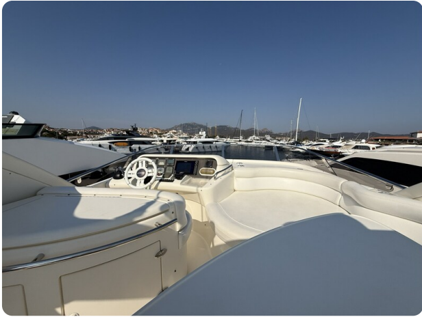
AZIMUT 55 Fly detail