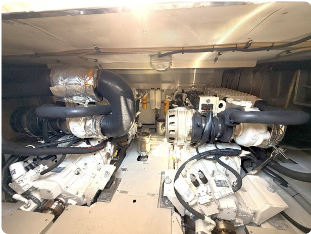
{1} Engine room