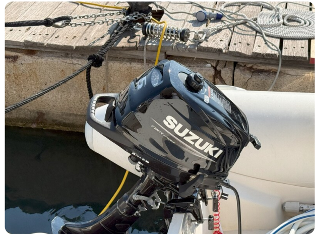
New tender's engine