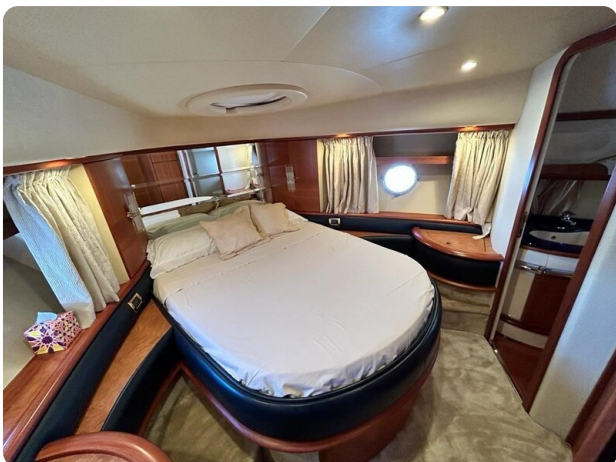
Az 62 Cabina VIP