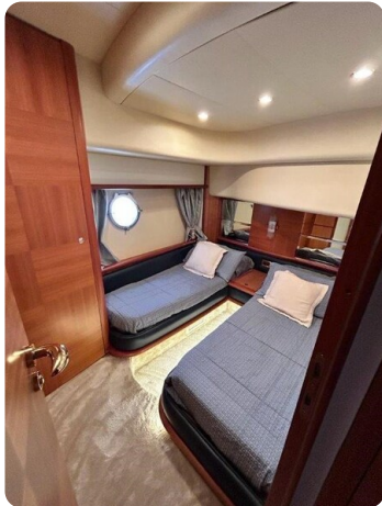
Az 62 Cabina ospiti letti doppi