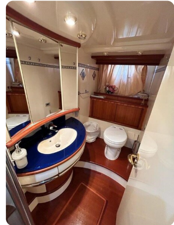
Az 62 Bagno armatore (1)