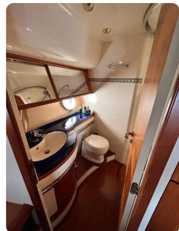
Az 62 Bagno cabina Vip prua