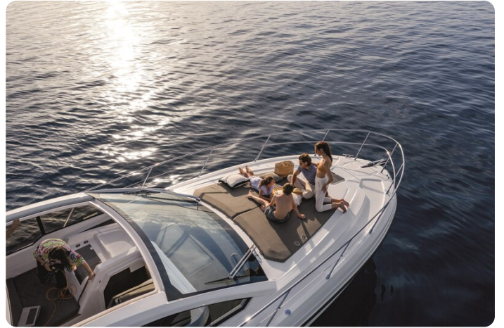
A45 Exterior View 2