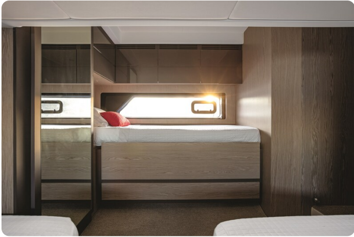
A45 Guest Cabin with Third Bed