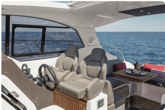
A45 Helmstation Seats