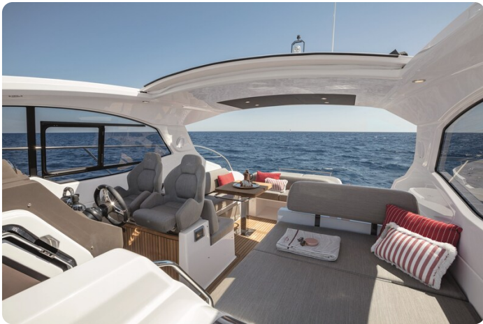
A45 Maindeck 2