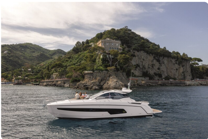
A45 Exterior View 1