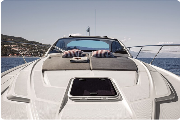
A45 Front View