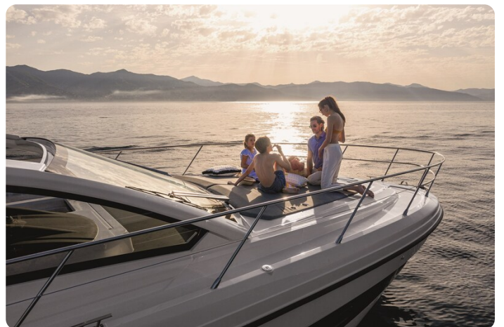
A45 Exterior View 3