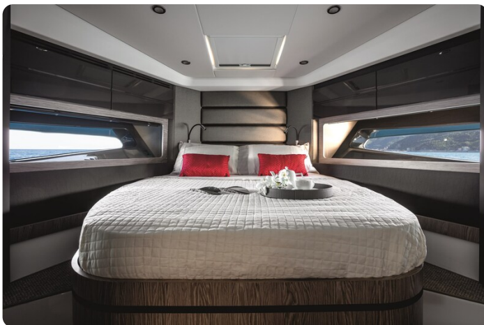
A45 Master Cabin