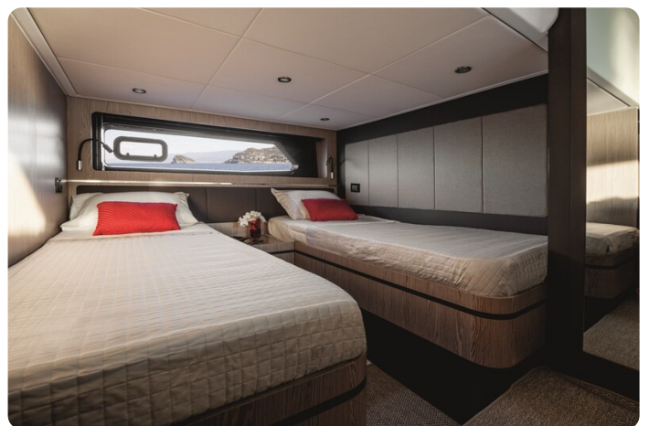
A45 Guest Cabin Twin beds