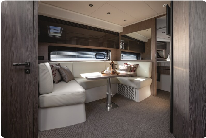
A45 Dinette 2