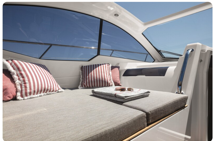
A45 Relax Area