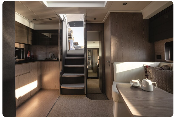
A45 Dinette 1