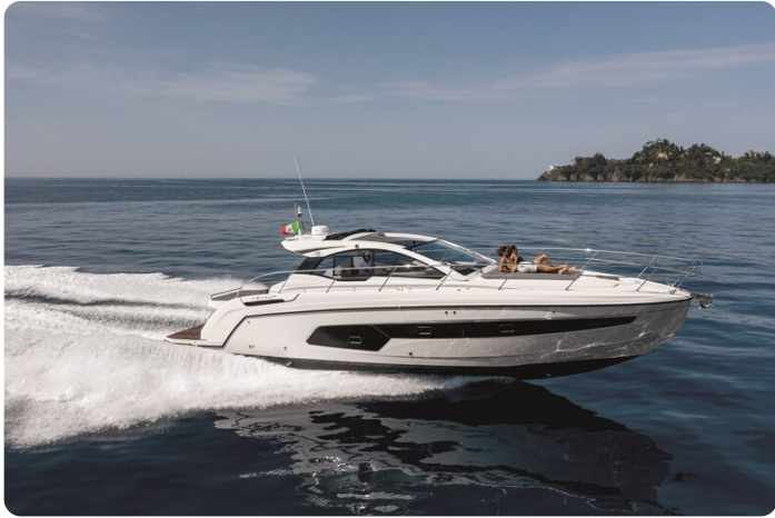
A45 Running 4