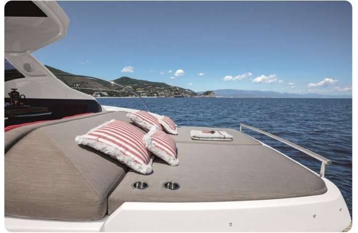
A45 Aft Sunpad 2