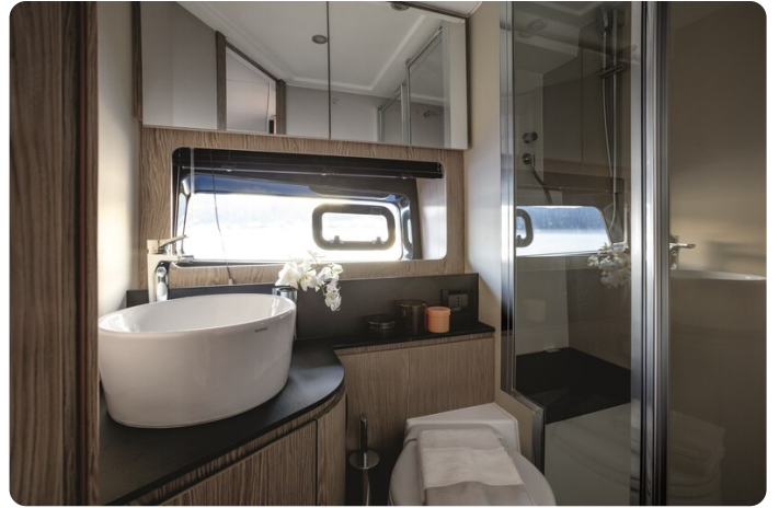
A45 Master Head