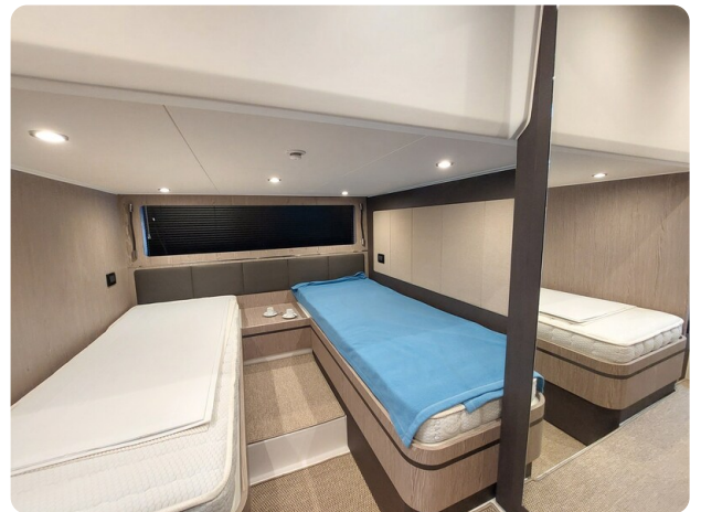
Azimut Atlantis 45 guest cabin