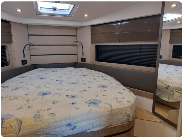
Azimut Atlantis 45 Owners cabin