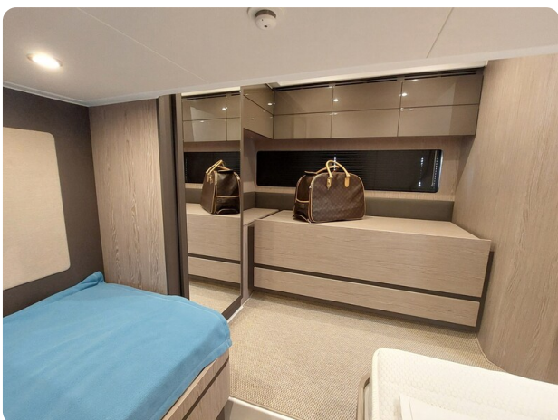
Azimut Atlantis 45 guest cabin detail