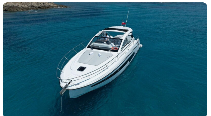
A45 Exterior View