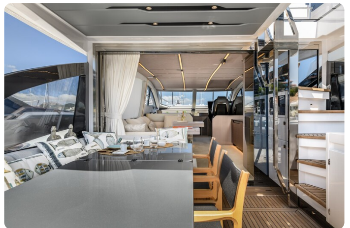
Azimut S7New cockpit and salon