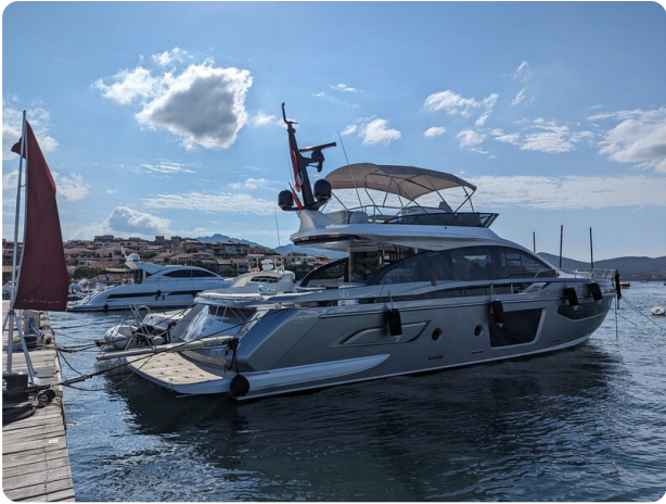
Azimut S7New aft profile