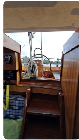
Baltika Decksalon SY 32