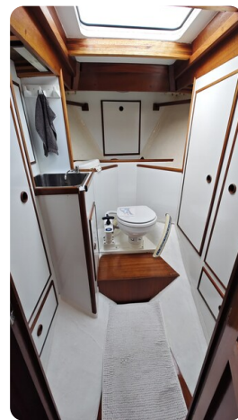
Baltika Decksalon SY 25