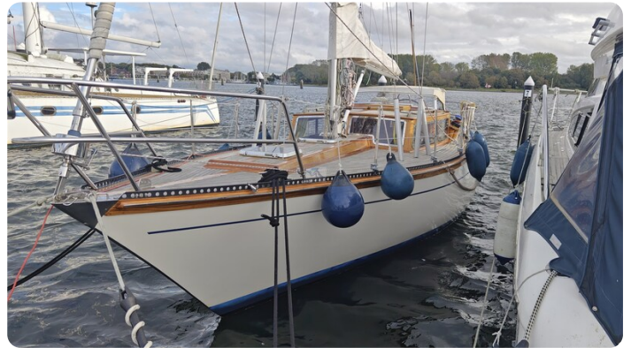
Baltika Decksalon SY 4