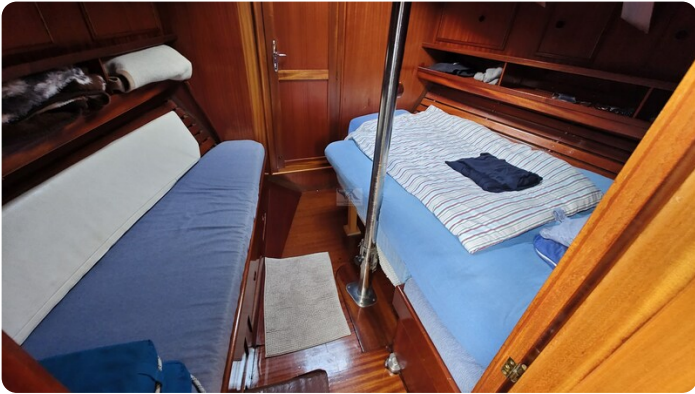
Baltika Decksalon SY 24