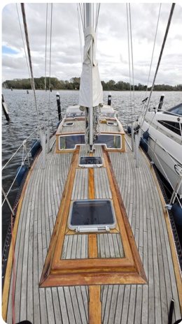
Baltika Decksalon SY 6