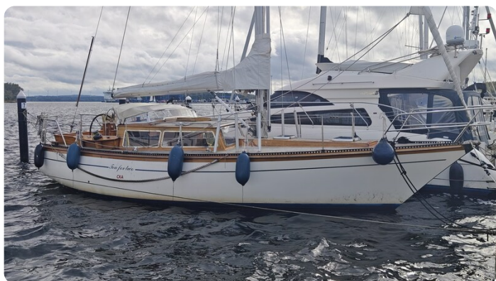
Baltika Decksalon SY 2