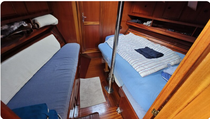
Baltika Decksalon SY 24