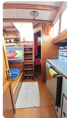
Baltika Decksalon SY 27