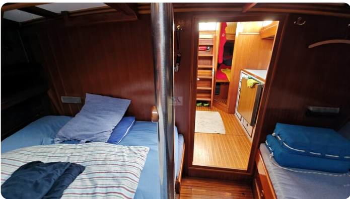
Baltika Decksalon SY 26