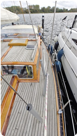
Baltika Decksalon SY 10