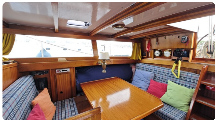
Baltika Decksalon SY 19