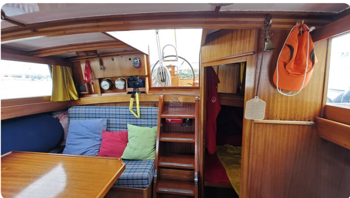
Baltika Decksalon SY 18