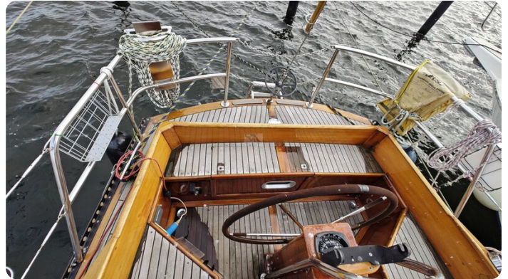
Baltika Decksalon SY 12