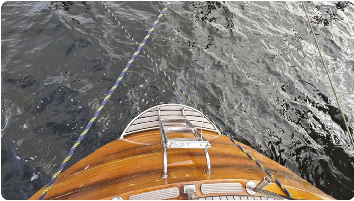
Baltika Decksalon SY 13