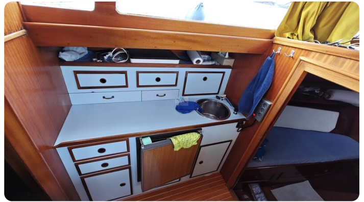
Baltika Decksalon SY 22