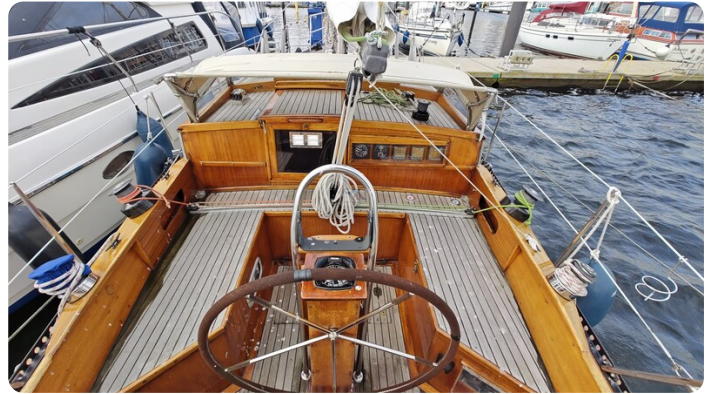
Baltika Decksalon SY 14