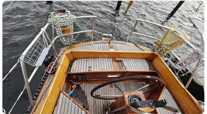
Baltika Decksalon SY 12