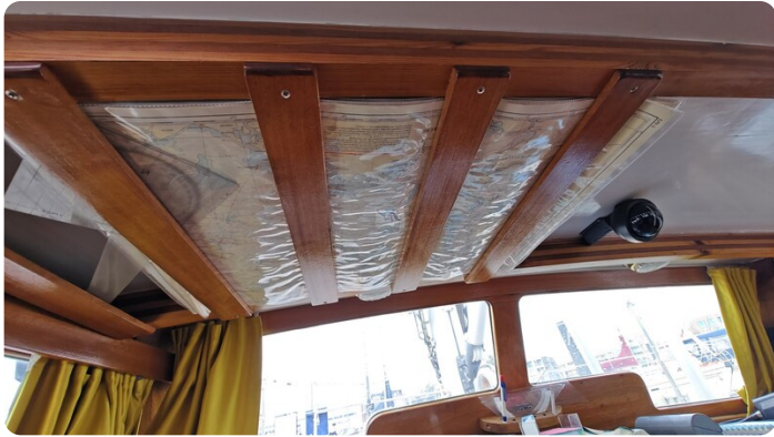
Baltika Decksalon SY 29