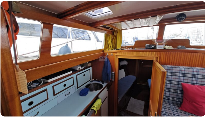
Baltika Decksalon SY 21