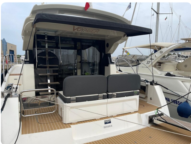
Bavaria 420 coupè