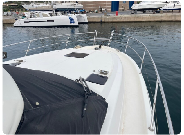
Bavaria 420 coupè