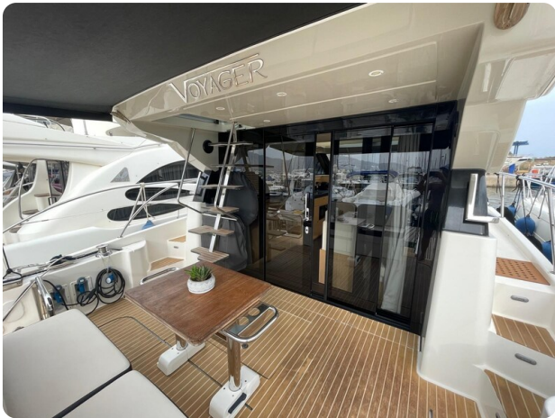
Bavaria 420 coupè