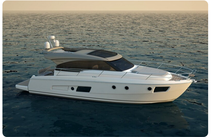
Bavaria 420 coupè sistership