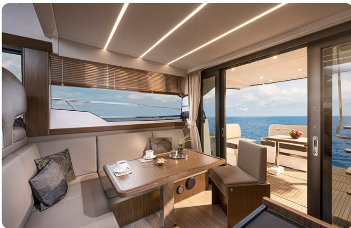
Bavaria 420 coupè dinette