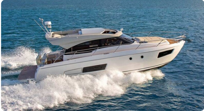
Bavaria 420 coupè Sistership