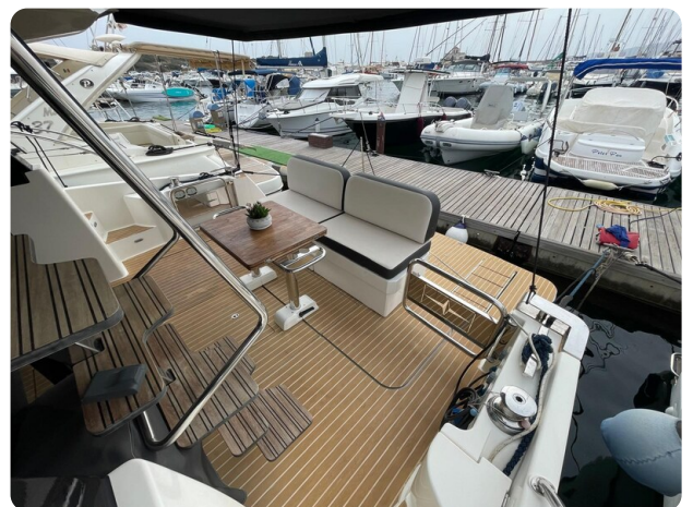
Bavaria 420 coupè