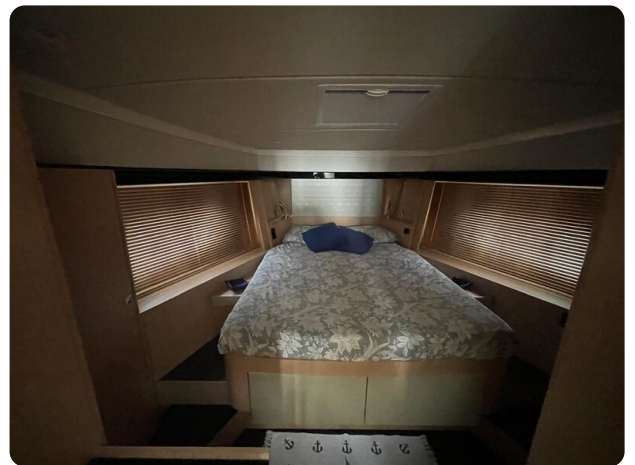
Bavaria 420 coupè