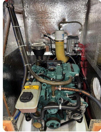
Bavaria 32 Cruiser HERON 19