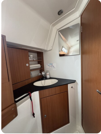
Bavaria 32 Cruiser HERON 43