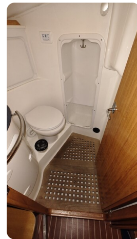
Bavaria 37 msp749314 18