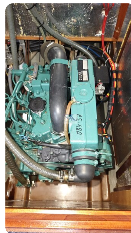
Bavaria 37_msp 25