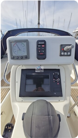
Bavaria 37_msp 66