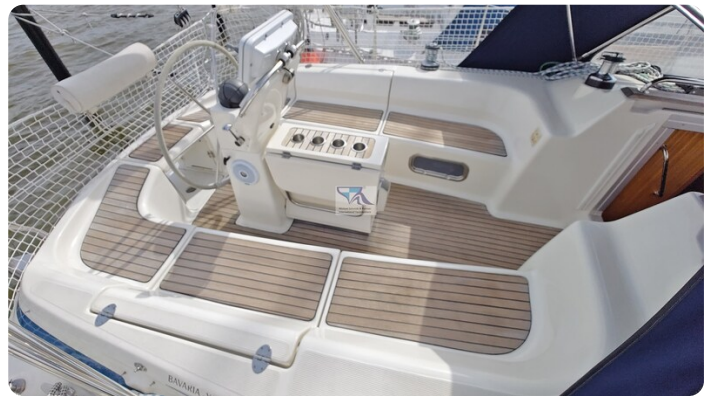
Bavaria 37_msp 60