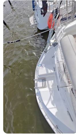
Bavaria 37_msp 64