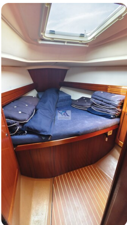
Bavaria 37_msp 21