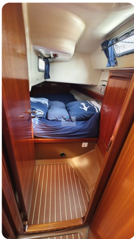
Bavaria 37_msp 17