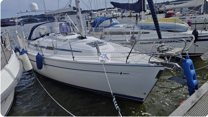
Bavaria 37_msp 49