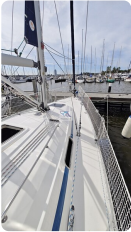
Bavaria 37_msp 35