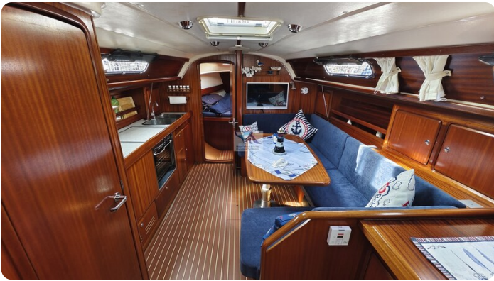
Bavaria 37_msp 11