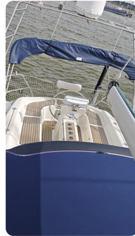
Bavaria 37_msp 57