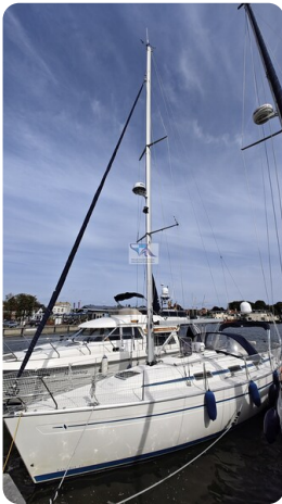
Bavaria 37_msp 51