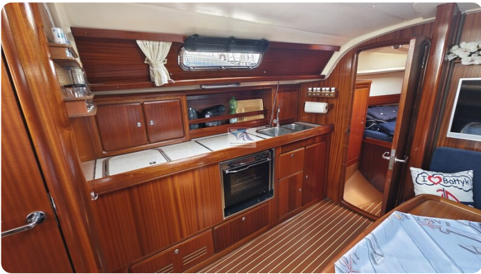
Bavaria 37_msp 14