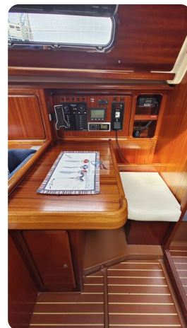
Bavaria 37_msp 8