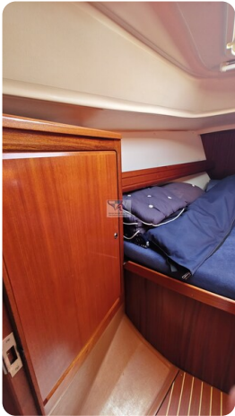
Bavaria 37_msp 23