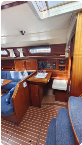
Bavaria 37_msp 7