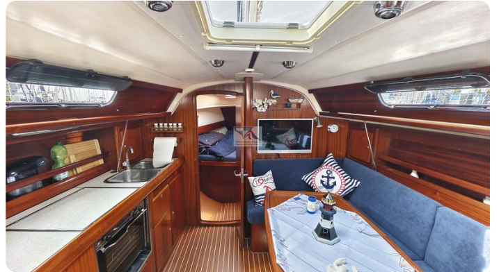
Bavaria 37_msp 20