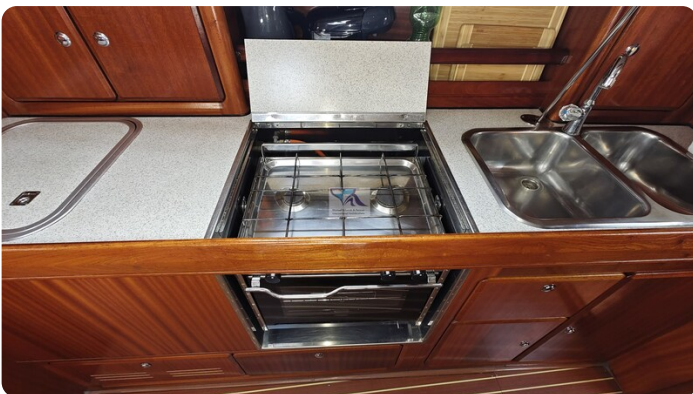
Bavaria 37_msp 31