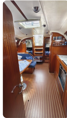
Bavaria 37_msp 24