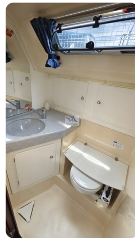
Bavaria 37_msp 18