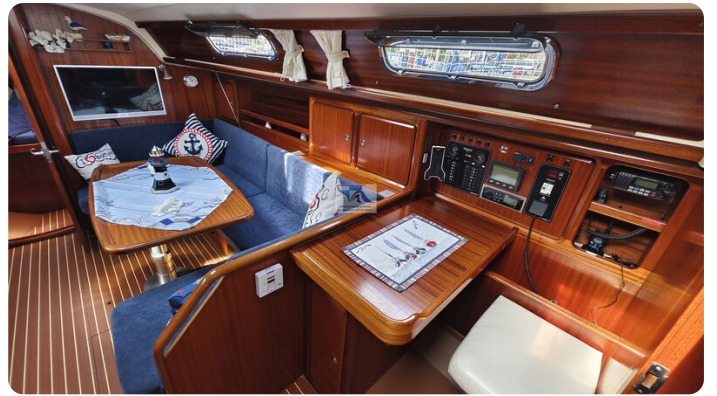
Bavaria 37_msp 12