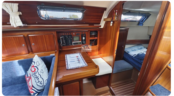
Bavaria 37_msp 15