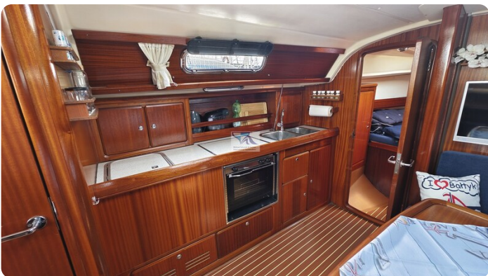
Bavaria 37_msp 14