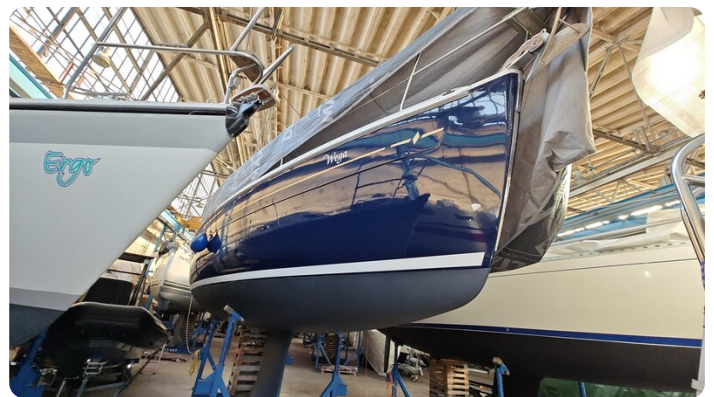
Bavaria 37 msp749314 5