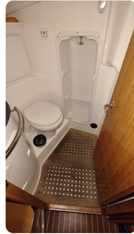
Bavaria 37 msp749314 18