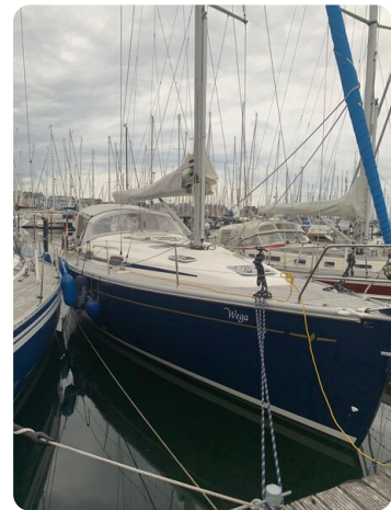
Bavaria 37 msp749314 3