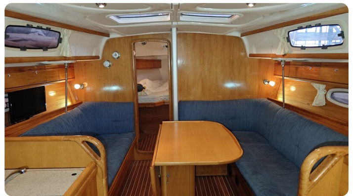
Bavaria 37 msp749314 12