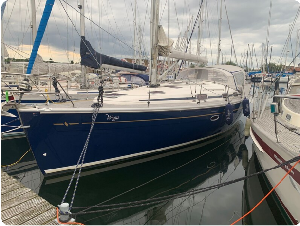
Bavaria 37 msp749314 1