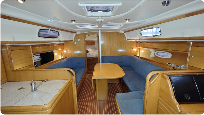
Bavaria 37 msp749314 13