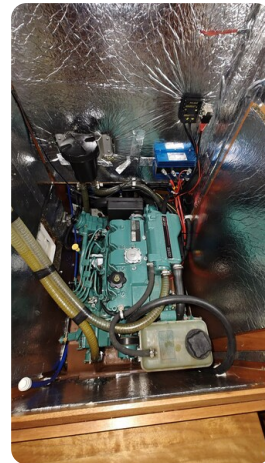
Bavaria 37 msp749314 23