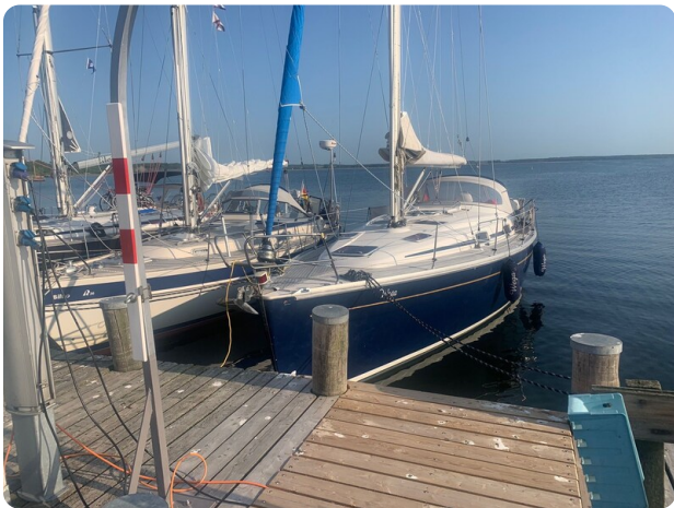
Bavaria 37 msp749314 2