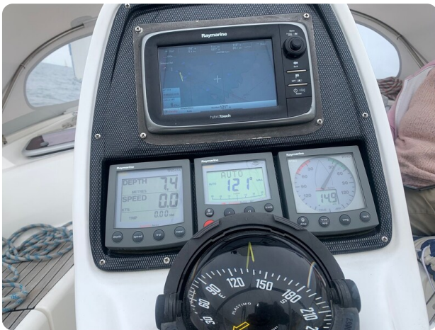
Bavaria 37 msp749314 10