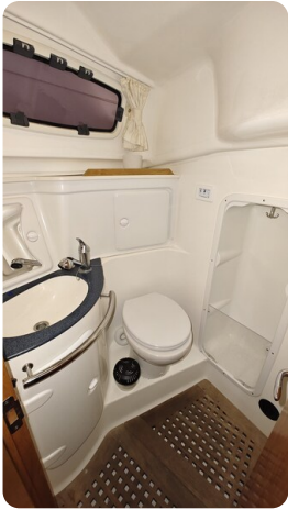
IBavaria 37 msp749314 17