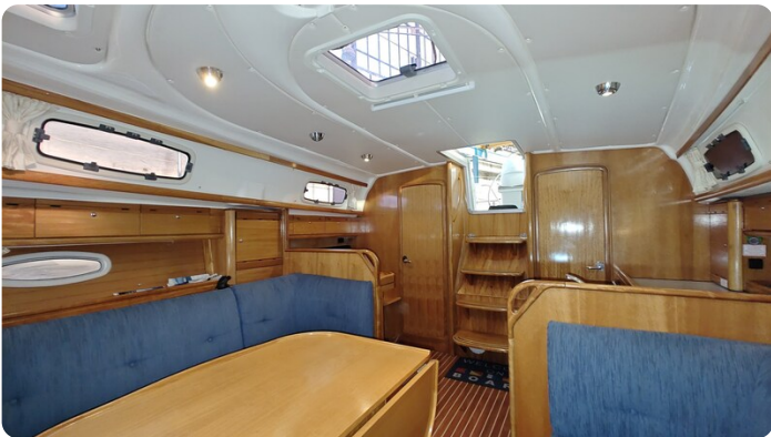
IBavaria 37 msp749314 22