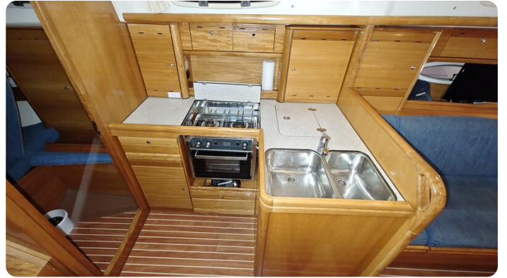
Bavaria 37 msp749314 14