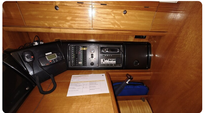
Bavaria 37 msp749314 16