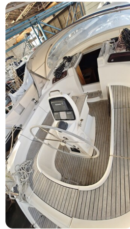
Bavaria 37 msp749314 8