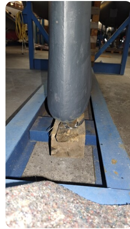
Bavaria 37 msp749314 7