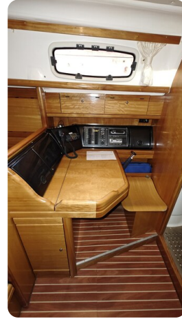
Bavaria 37 msp749314 21