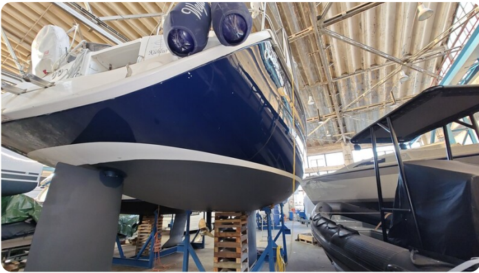
Bavaria 37 msp749314 6