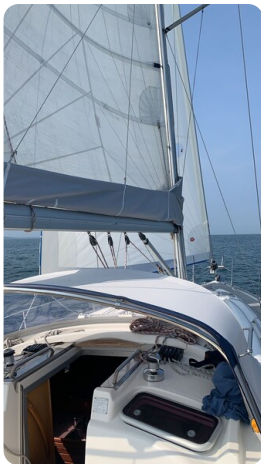
Bavaria 37 msp749314 4