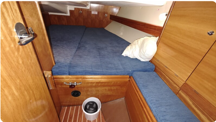
Bavaria 37 msp749314 15