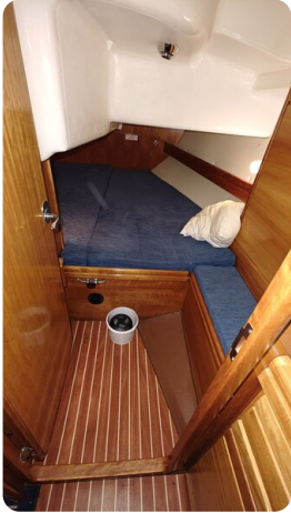
Bavaria 37 msp749314 20