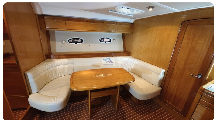
Bavaria 37 Sport msp793423 52