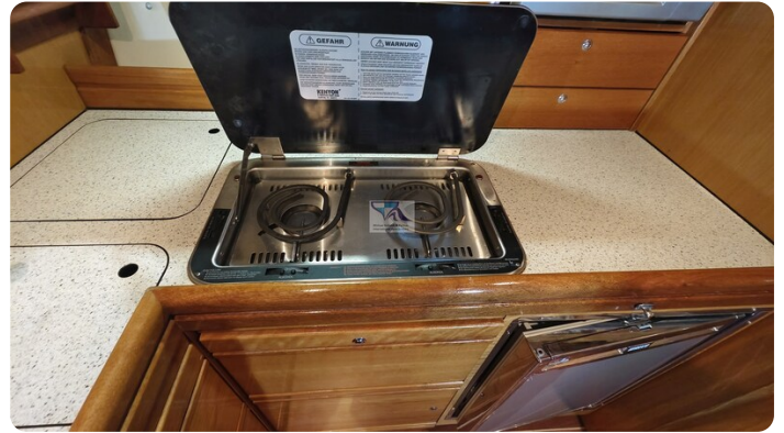
Bavaria 37 Sport msp793423 68