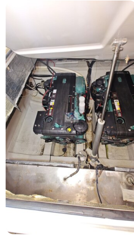
Bavaria 37 Sport msp793423 41