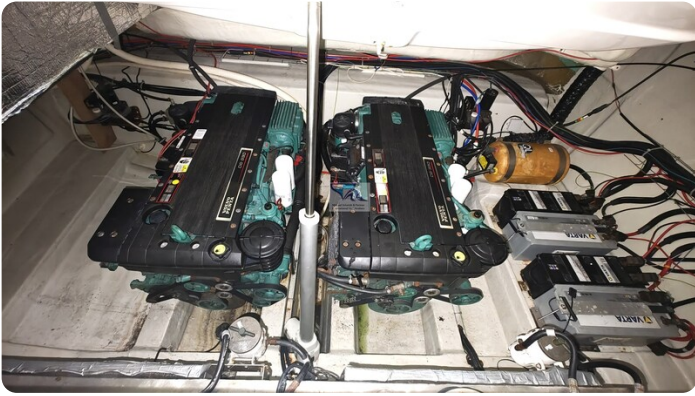
Bavaria 37 Sport msp793423 36