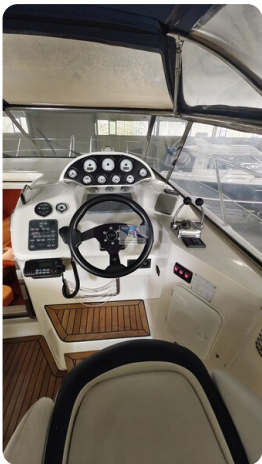
Bavaria 37 Sport msp793423 25