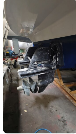
Bavaria 37 Sport msp793423 2