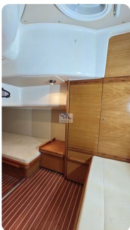
Bavaria 37 Sport msp793423 49