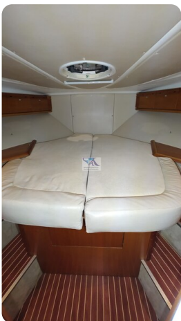
Bavaria 37 Sport msp793423 76