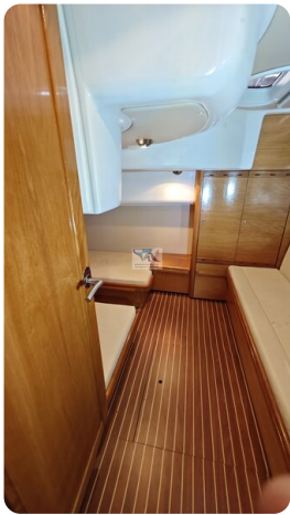
Bavaria 37 Sport msp793423 47