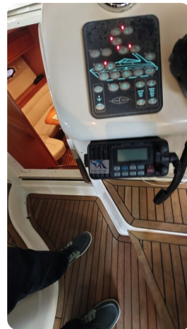
Bavaria 37 Sport msp793423 31