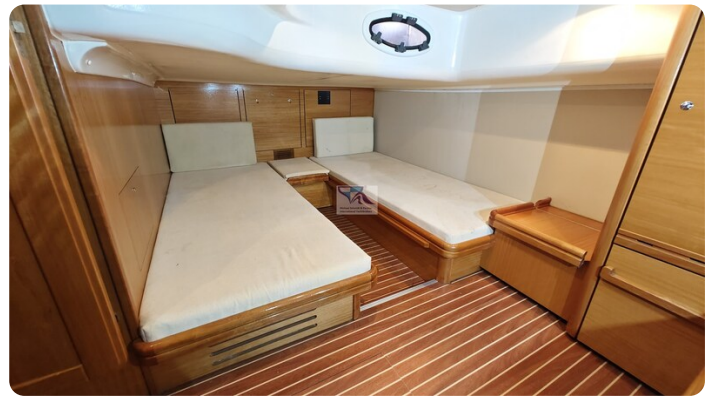
Bavaria 37 Sport msp793423 48