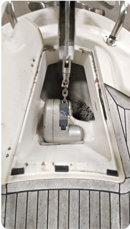
Bavaria 37 Sport msp793423 12