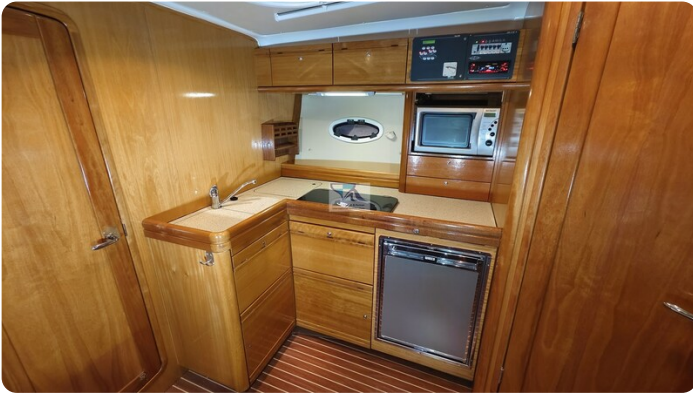
Bavaria 37 Sport msp793423 63