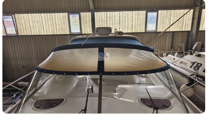
Bavaria 37 Sport msp793423 16