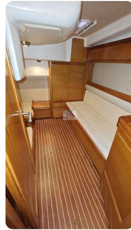
Bavaria 37 Sport msp793423 43