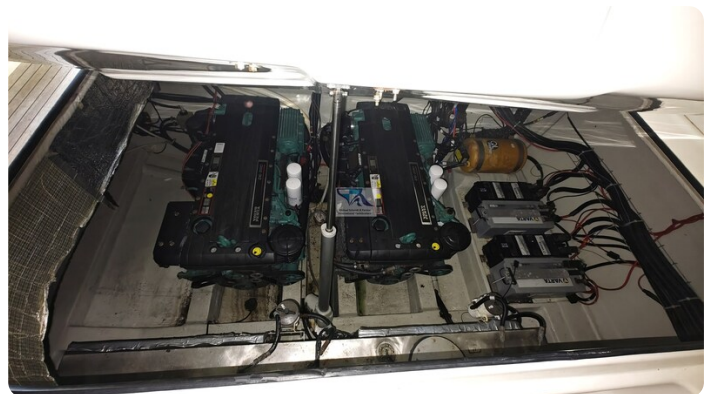
Bavaria 37 Sport msp793423 35