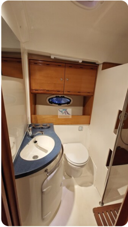
Bavaria 37 Sport msp793423 59