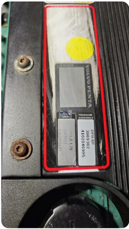
Bavaria 37 Sport msp793423 33