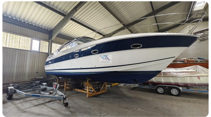
Bavaria 37 Sport msp793423 4