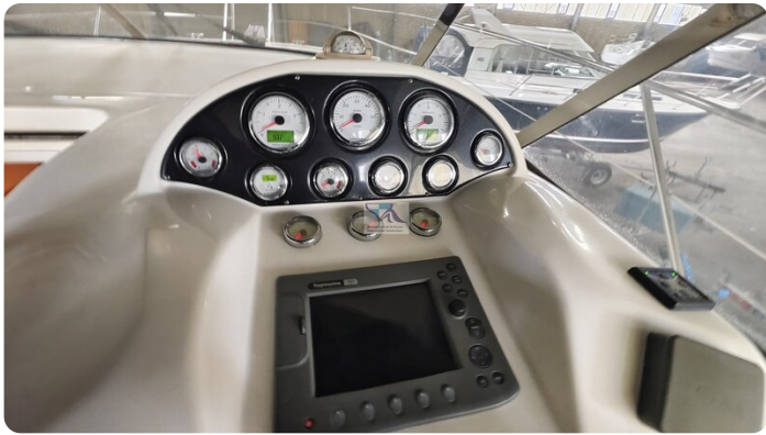
Bavaria 37 Sport msp793423 28