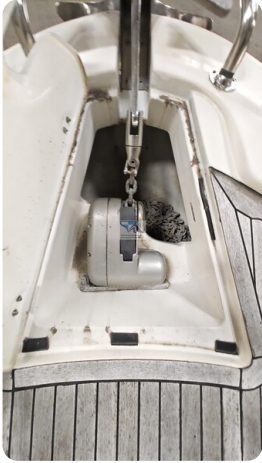
Bavaria 37 Sport msp793423 12