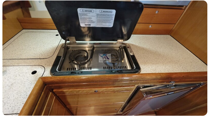
Bavaria 37 Sport msp793423 68