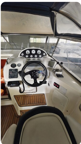
Bavaria 37 Sport msp793423 25