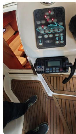
Bavaria 37 Sport msp793423 31