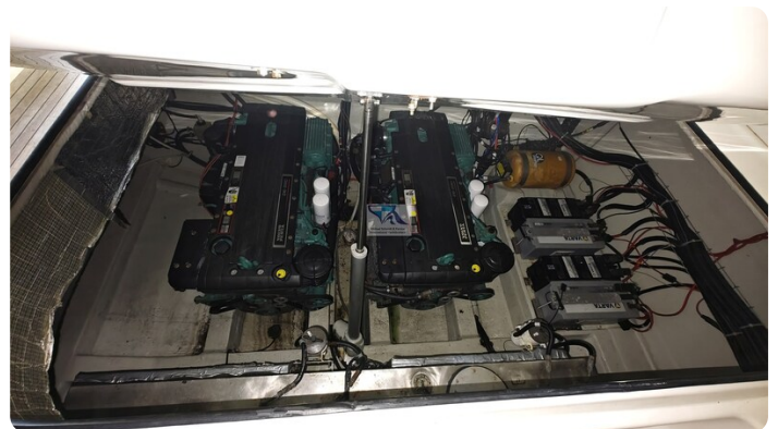
Bavaria 37 Sport msp793423 35