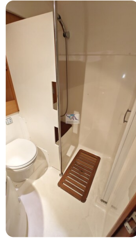
Bavaria 37 Sport msp793423 62