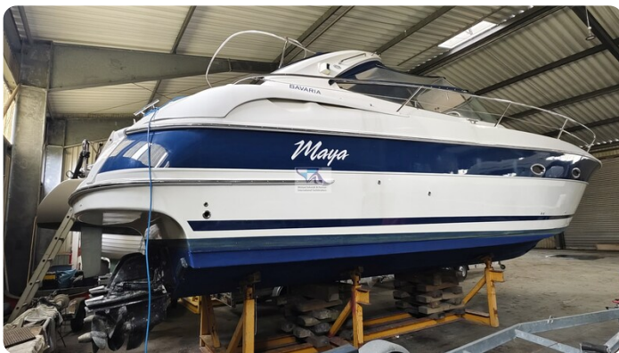
Bavaria 37 Sport msp793423 1