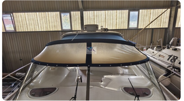
Bavaria 37 Sport msp793423 16