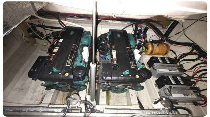
Bavaria 37 Sport msp793423 36