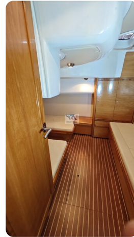
Bavaria 37 Sport msp793423 47