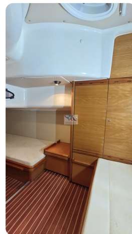
Bavaria 37 Sport msp793423 49