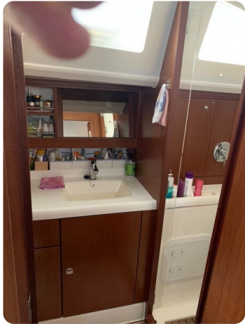
Bav 46-2_msp756752 9