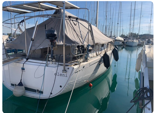
Bav 46-2_msp756752 4