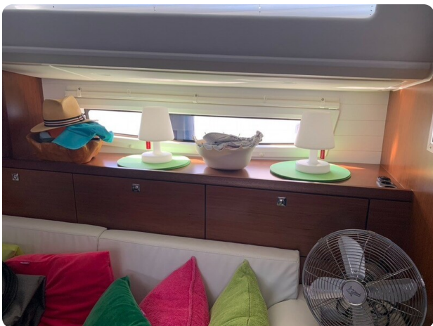
lBav 46-2_msp756752 11