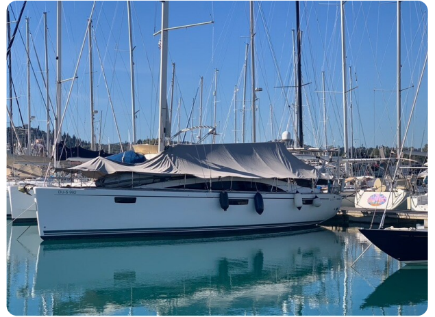
Bav 46-2_msp756752 2