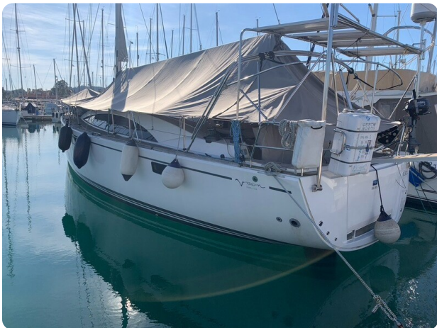
Bav 46-2_msp756752 3