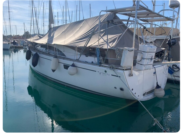
Bav 46-2_msp756752 3