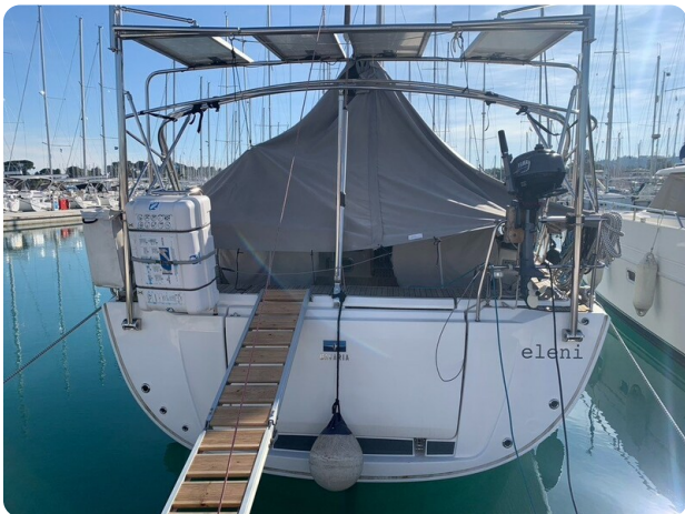
Bav 46-2_msp756752 5