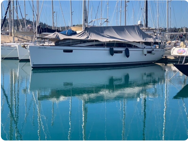
Bav 46-2_msp756752 1