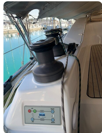
Bav 46-2_msp756752 6