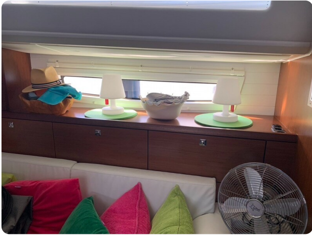
IBav 46-2_msp756752 11