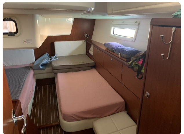
Bav 46-2_msp756752 8