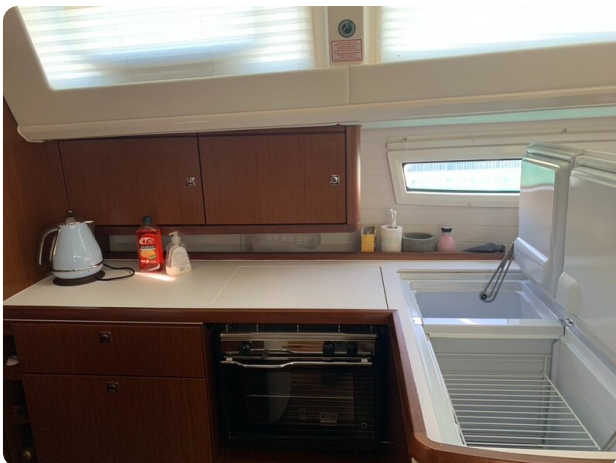
Bav 46-2_msp756752 7