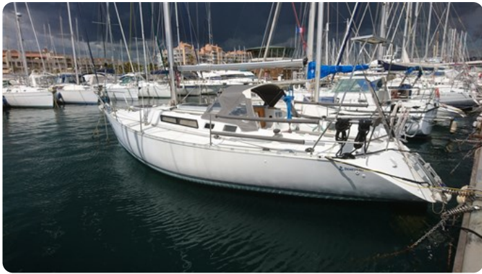
A Vue generale