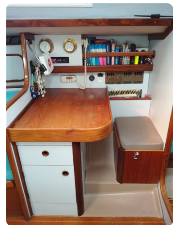
Table à cartes 1