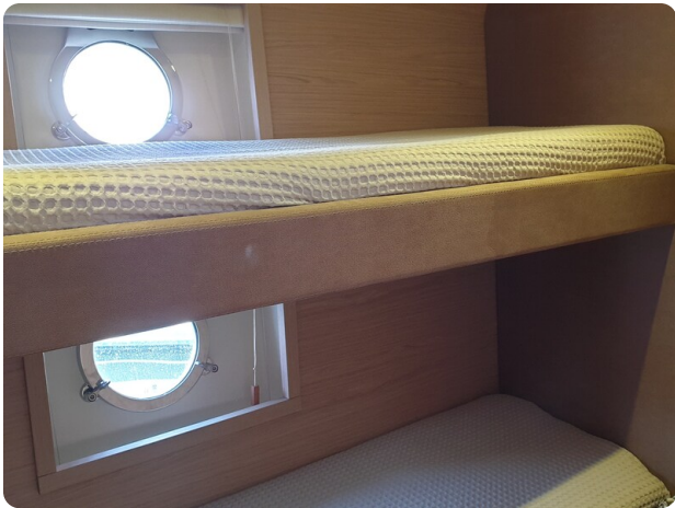
{1} Guest cabin