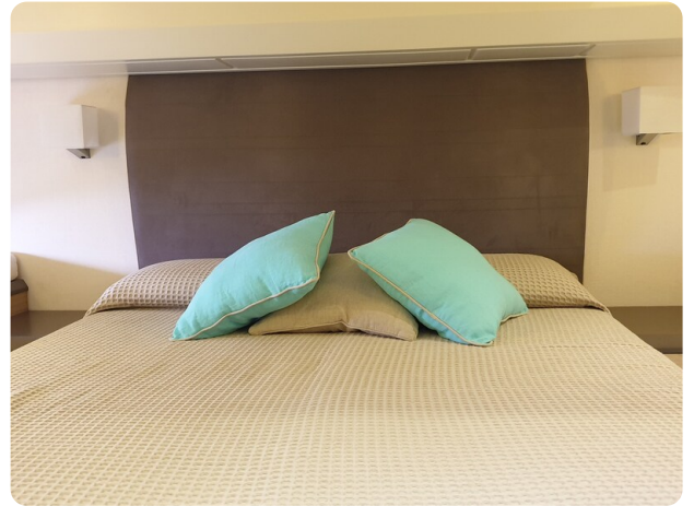
{1} Owner's cabin