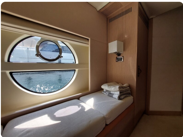
{1} Owner's cabin detail