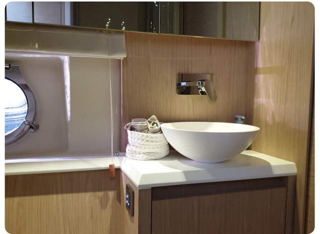
{1} Owner's bathroom