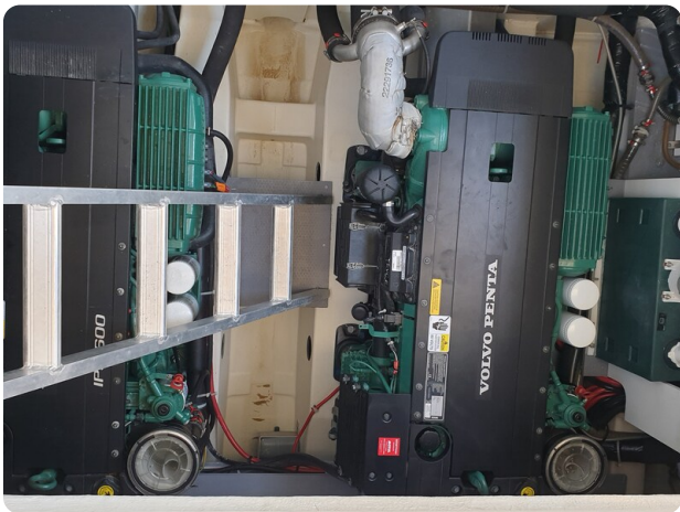
{1} Engine room