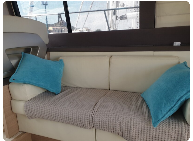
{1} Salon lounge