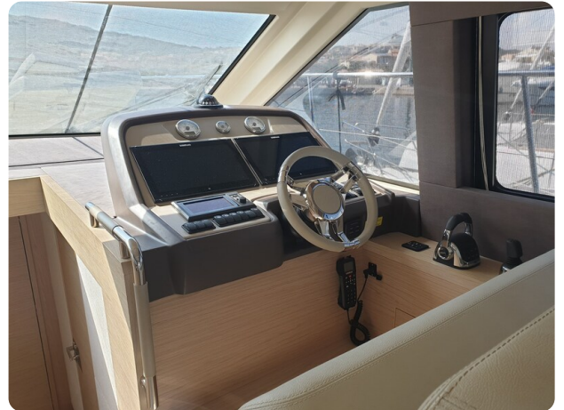
{1} Helm station