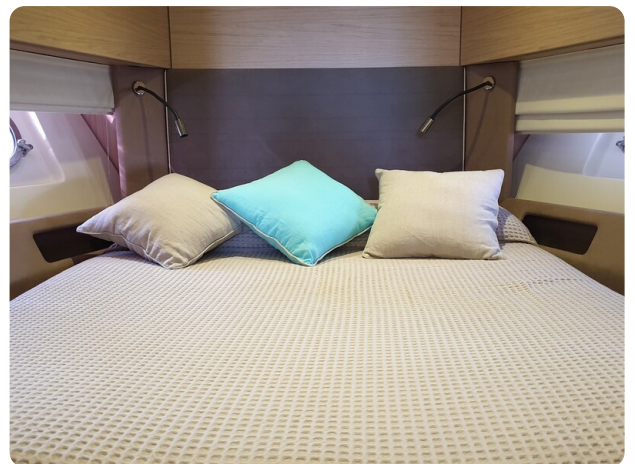
{1} Vip cabin