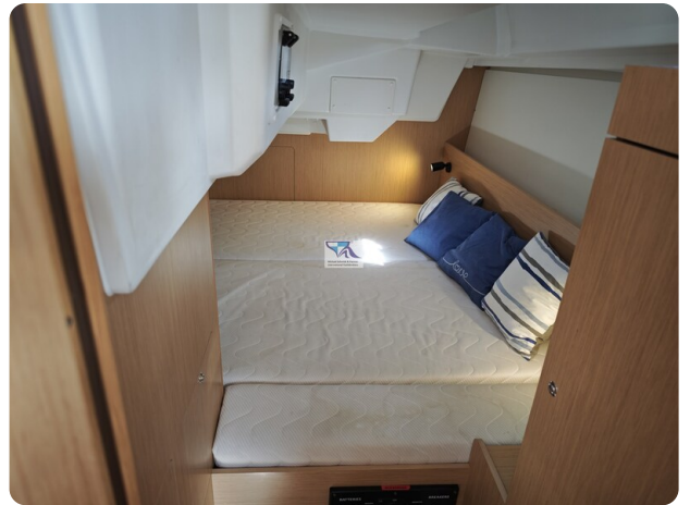
Oceanis 35.1 37