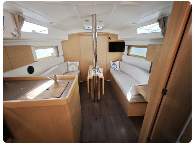
Oceanis 35.1 10