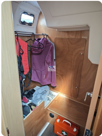
Oceanis 35.1 35