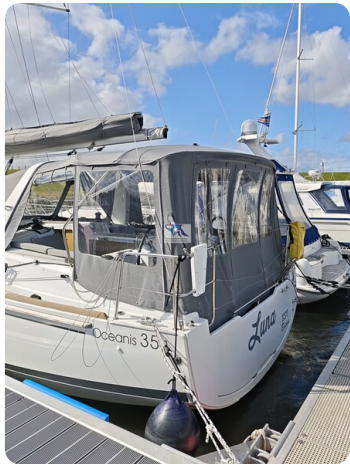
Oceanis 35.1 5