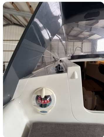
Bente 24 MUGGEL 18