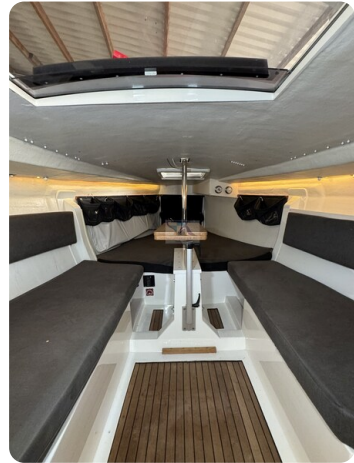
Bente 24 MUGGEL 47