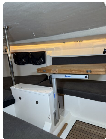
Bente 24 MUGGEL 49