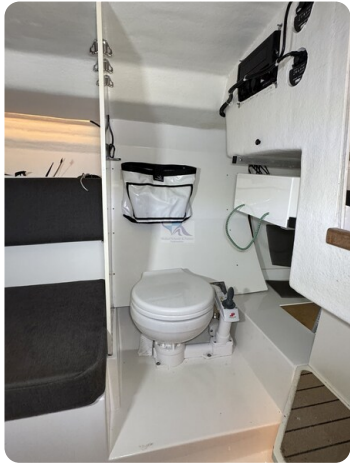
Bente 24 MUGGEL 59