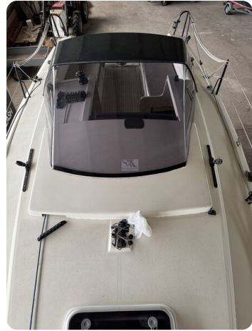
Bente 24 MUGGEL 27