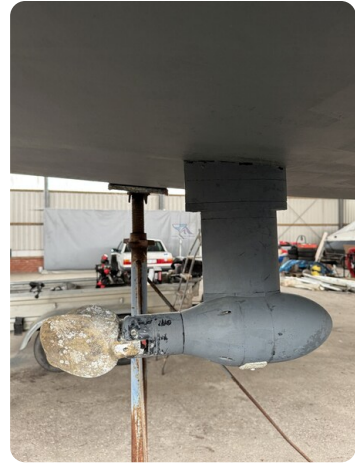
Bente 24 MUGGEL 5