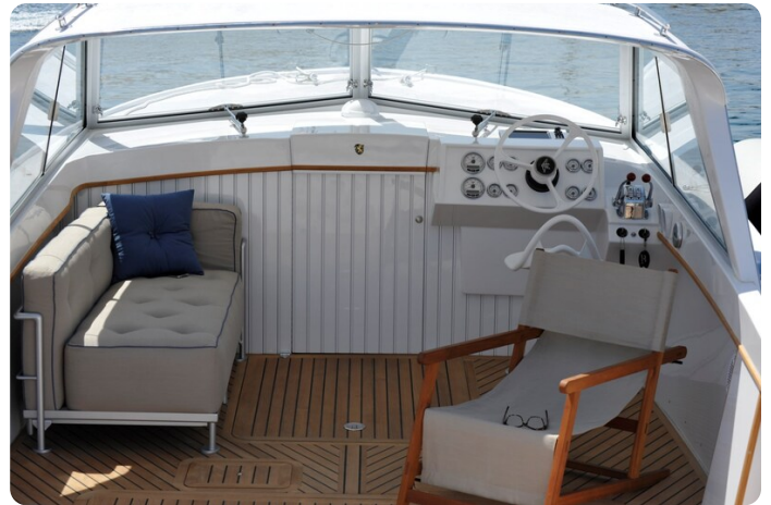
Bertram 25 MKII Hard Top cockpit dinette