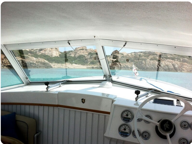
Bertram 25 MKII Hard Top detail 5