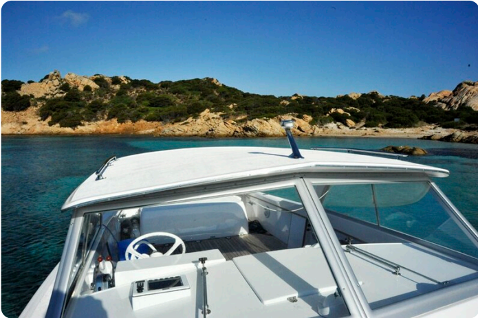
Bertram 25 MKII Hard Top windshield