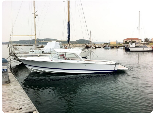
Bertram 25 MKII Hard Top