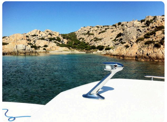
Bertram 25 MKII Hard Top detail