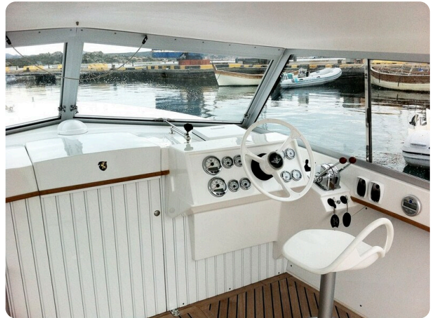
Bertram 25 MKII Hard Top helm