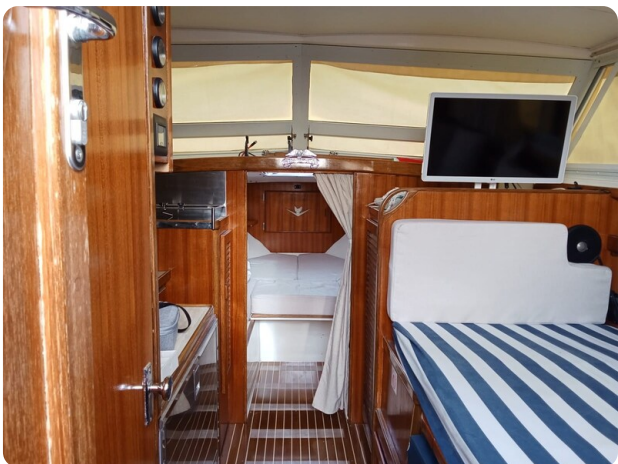
Bertram 28 Fbc fwd cabin view