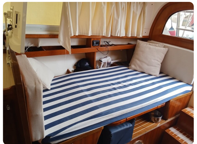
Bertram 28 Fbc conv. dinette