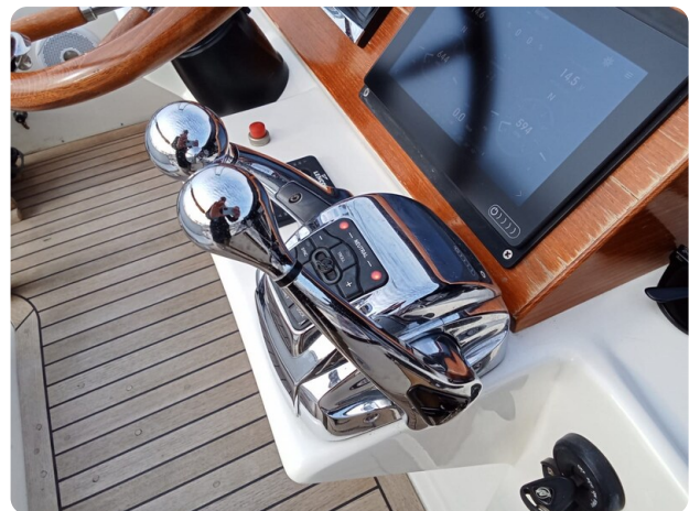
Bertram 28 Fbc controls