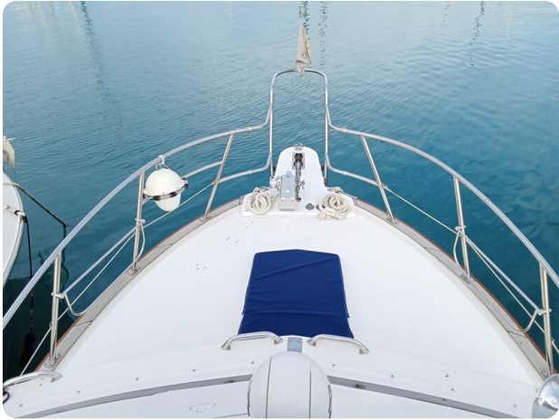
Bertram 28 Fbc fwd deck