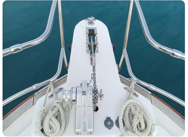
Bertram 28 Fbc bow pulpit