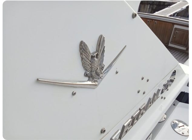
Bertram 28 Fbc Bertram logo