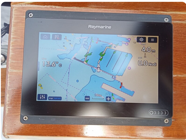
Bertram 28 Fbc electronic detail