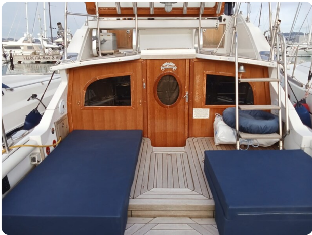
Bertram 28 Fbc cockpit sun pad