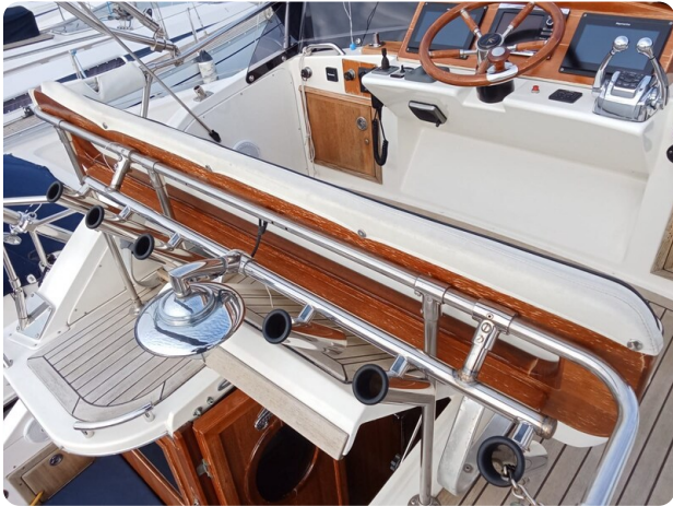
Bertram 28 Fbc