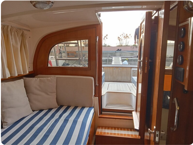
Bertram 28 Fbc interiors