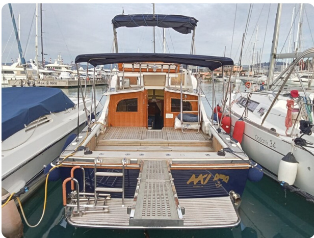
Bertram 28 Fbc stern view