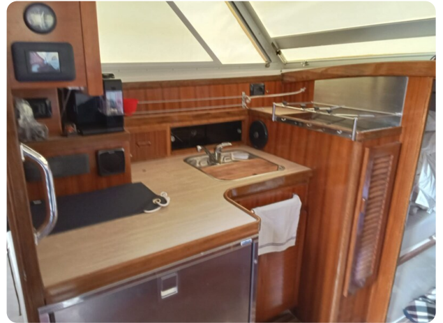
Bertram 28 Fbc galley