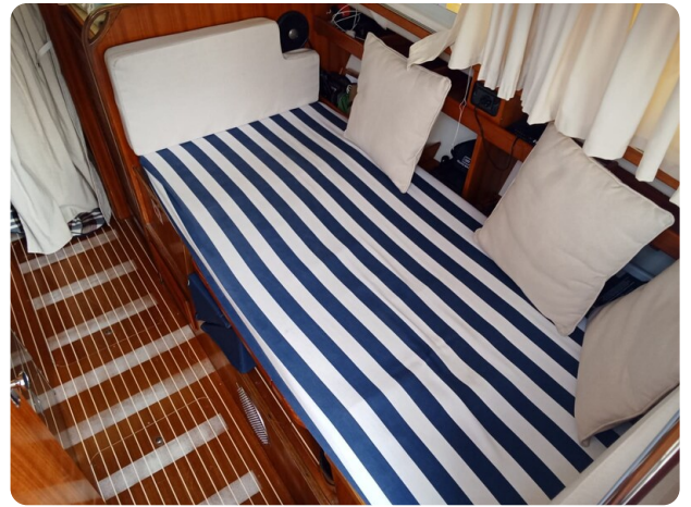
Bertram 28 Fbc dinette, convertible