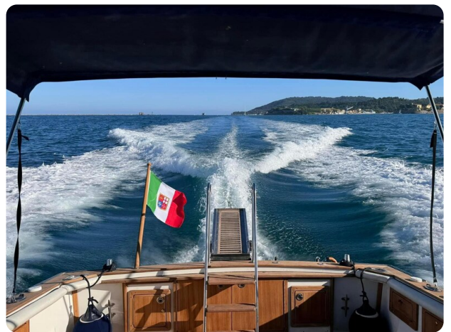
Bertram 28 Fbc running