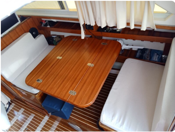
Bertram 28 Fbc dinette