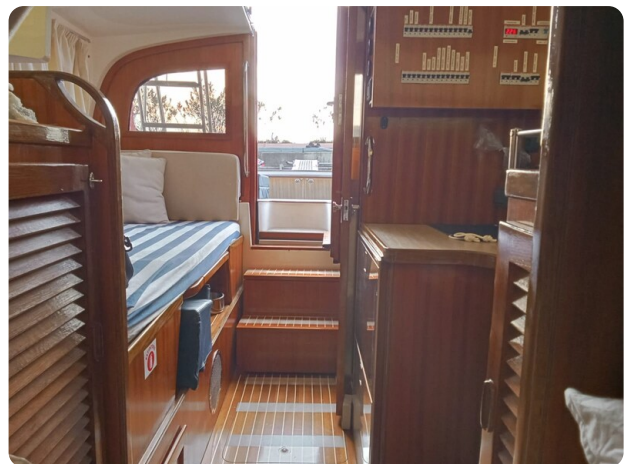
Bertram 28 Fbc internal view