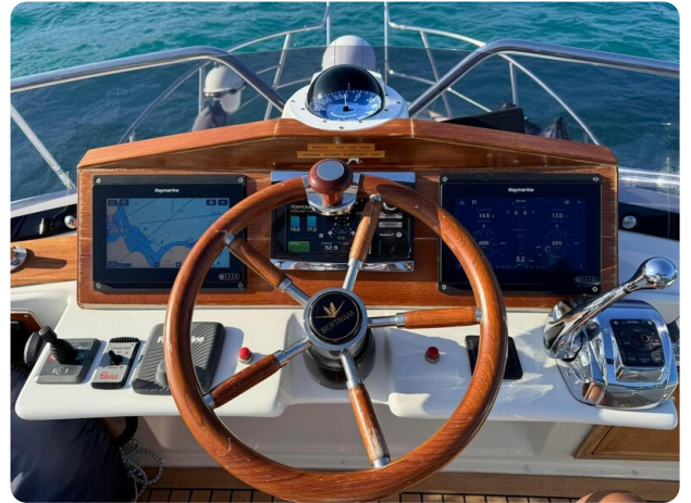
Bertram 28 Fbc helm station