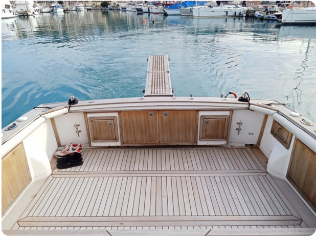
Bertram 28 Fbc cockpit