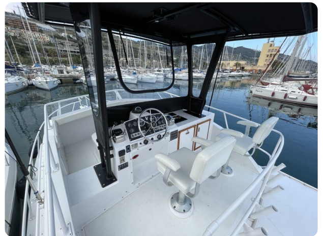
Bertram 33 Sport Fisherman17