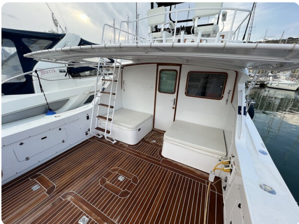
Bertram 33 Sport Fisherman2