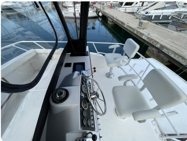
Bertram 33 Sport Fisherman15