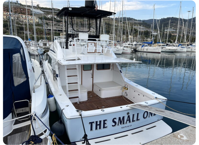
Bertram 33 Sport Fisherman1