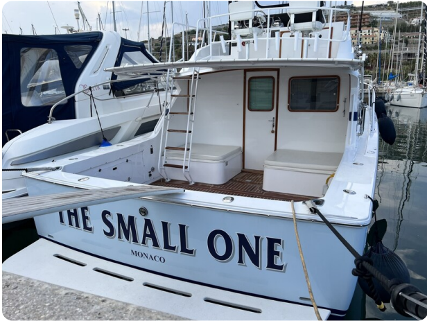
Bertram 33 Sport Fisherman