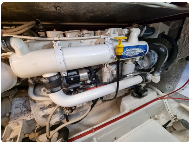
Bertram 35 engine detail