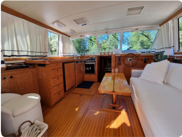
Bertram 35 salon view