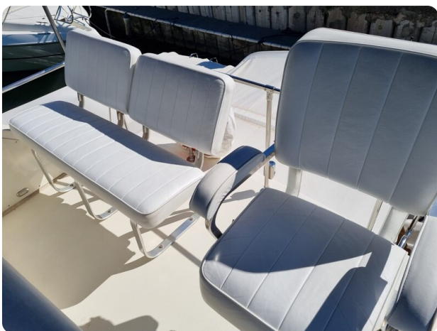
Bertram 35 Fly seats detail