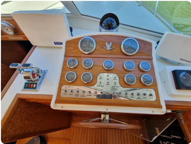
Bertram 35 helm detail