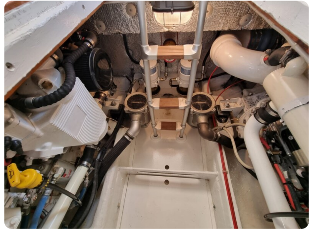
Bertram 35 engine room