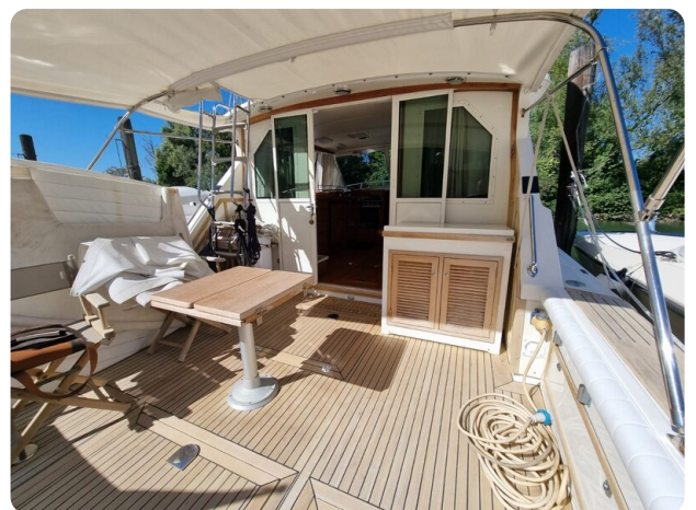
Bertram 35 cockpit