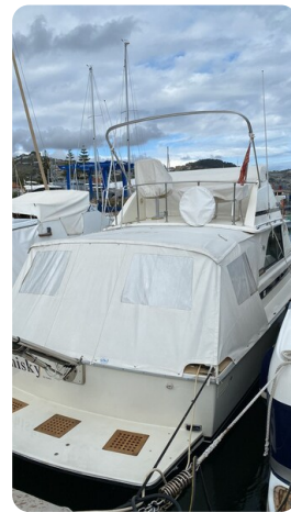
Bertram 35 cockpit cover