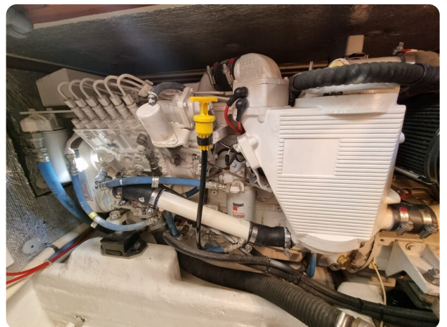
Bertram 35 engine view