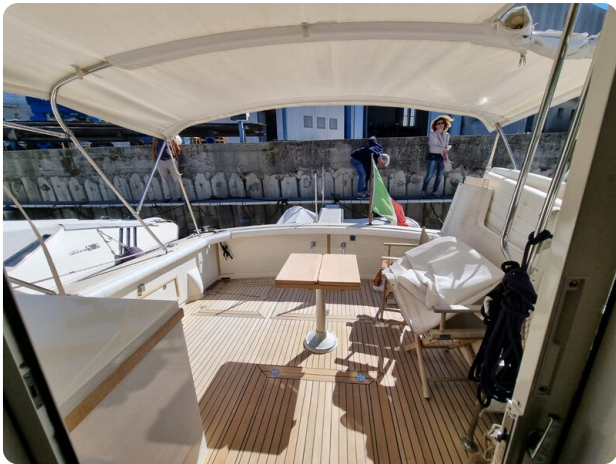
Bertram 35 cockpit view