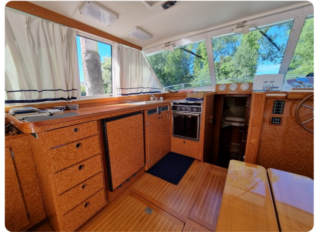
Bertram 35 salon