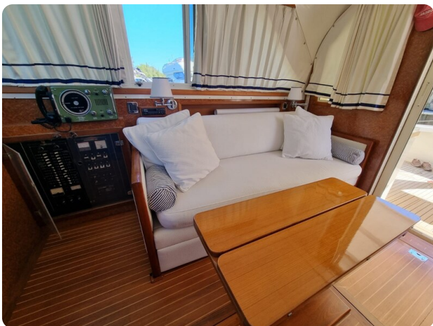
Bertram 35 dinette