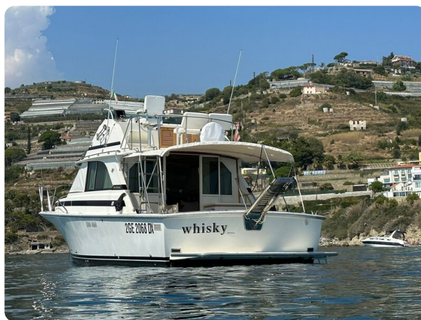
Bertram 35 aft view