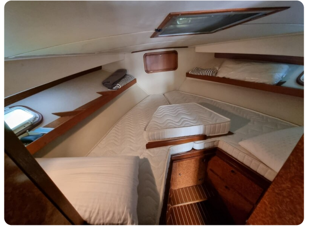
Bertram 35 cabin