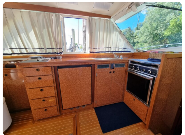
Bertram 35 galley (2)