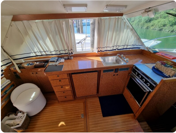
Bertram 35 galley