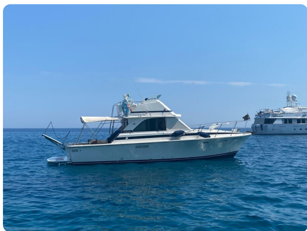
Bertram 35 anchored