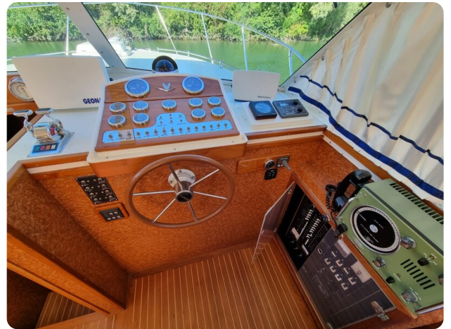
Bertram 35 lower helm