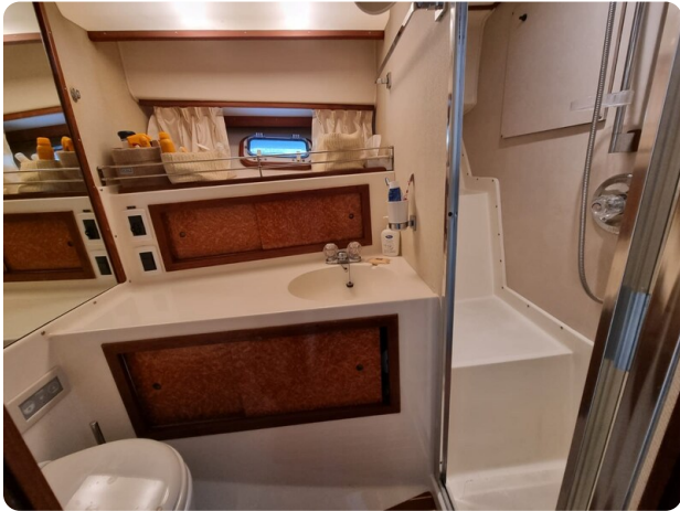
Bertram 35 bathroom