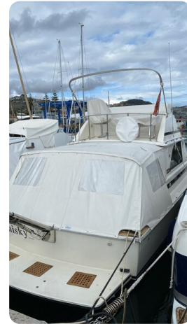
Bertram 35 cockpit cover