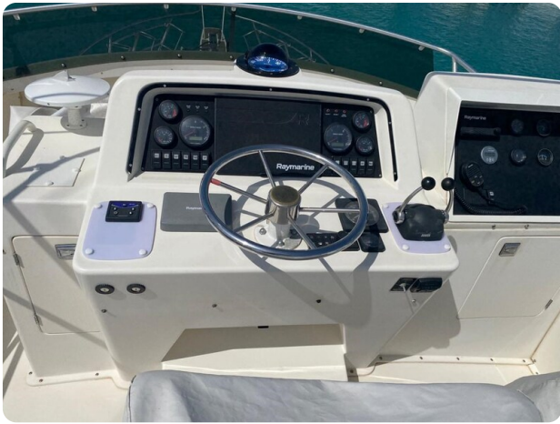
Bertram 37, Fly helm