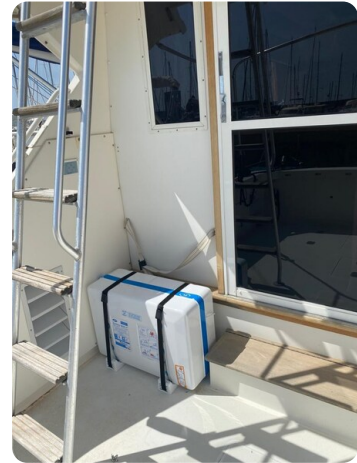
Bertram 37, cockpit details