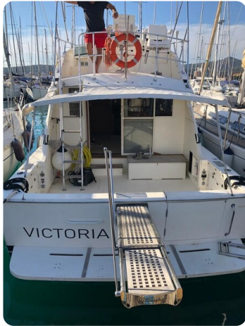
Bertram 37, aft view