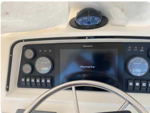
Bertram 37, electronics