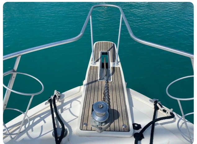
Bertram 37, bow pulpit