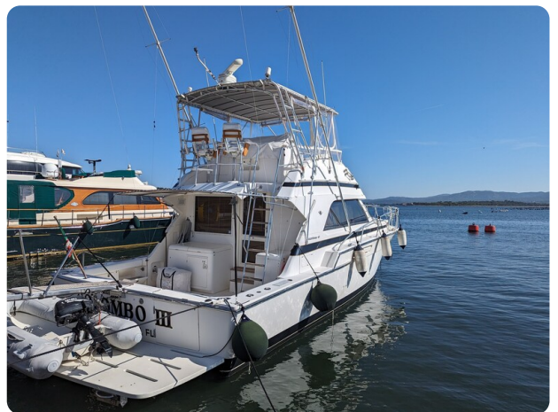
Bertram 43 Conv. aft profile