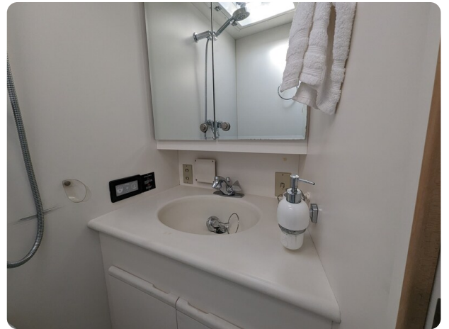
Bertram 43 Conv. guest bathroom