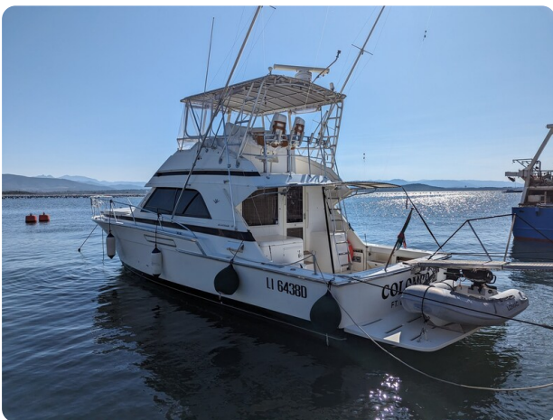
Bertram 43 Conv. profile