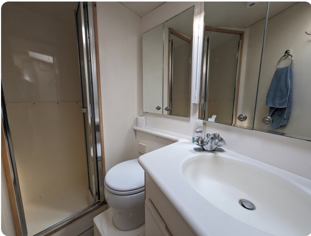
Bertram 43 Conv. master bathroom