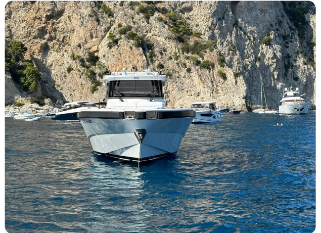
Bluegame 42 bow