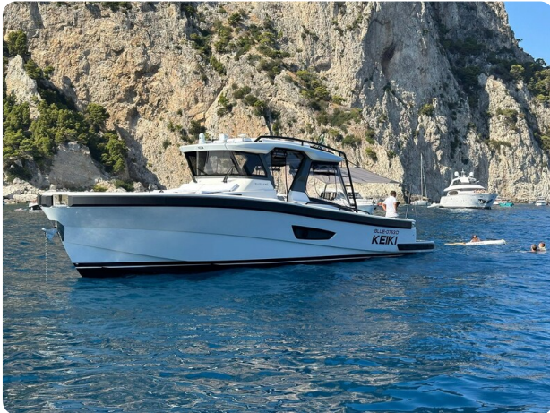
Bluegame 42 bow profile