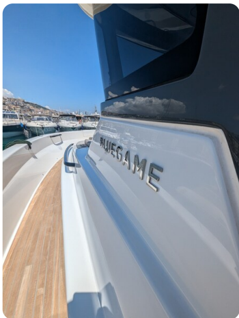
Bluegame 42 sideways detail