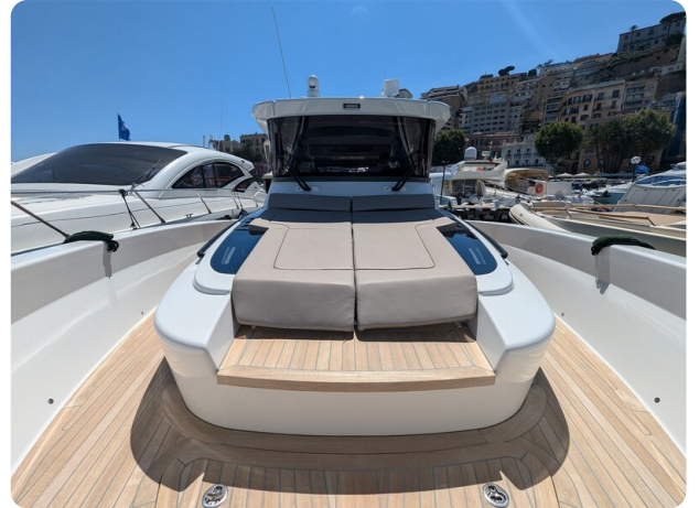
Bluegame 42 bow deck