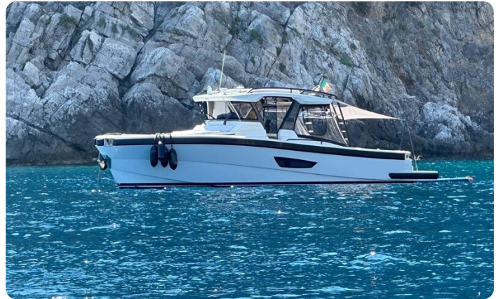
Bluegame 42 profile anchored 2