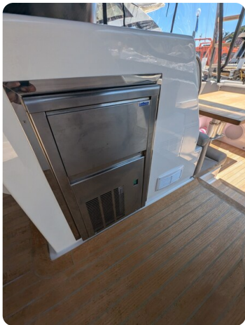
Bluegame 42 cockpit ice maker