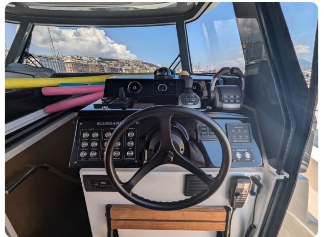
Bluegame 42 helm station